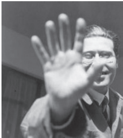
图1-9 | 纳吉 (Laszlo Moholy-Nagy)

替伊顿负责，如图 1-9 所示。纳吉是构成派的追随者，他将构成主义的要素带进了基础训练，强调形式和色彩的客观分析，注重点、线、面的关系。通过实践，使学生了解如何客观地分析二维空间的构成，并进而推广到三维空间的构成上；他还带领学生借鉴现代动感雕塑并结合光效内容，创立了增加运动与时间概念的四维空间，如图 1-10 所示。