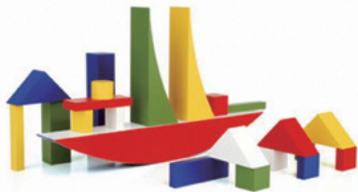
图1-4 | 用包豪斯彩色积木塑造的船舶和房屋