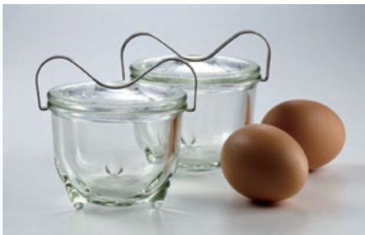
图1-17 | 华根菲尔德设计的煮蛋器

批量生产最有名的德国设计师之一,使工业设计的潜力在更加专业化的生产体系中得到了进一步的发挥。