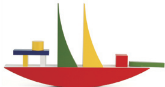
图1-3 | Alma Buscher 在 1924 年设计的包豪斯彩色积木船

然只用了几种最简单的几何形体,却把复杂的船的造型表现出来。从这个例子中我们可以了解到,整个立体构成的过程其实就是一个把复杂物体由繁到简、再由简到繁,或者由分割到组合再由组合到分割的过程,任何形体都可以还原到最基础的点、线、面,而点、线、面又可以构成任何形体,所以点、线、面的观念是立体构成最基本的观念。