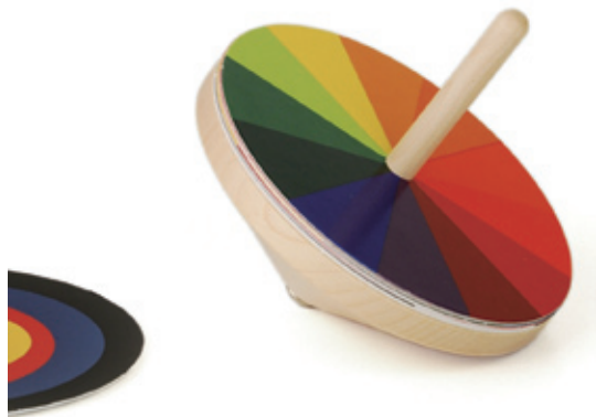
图1-24 | 包豪斯“光学混彩陀螺”