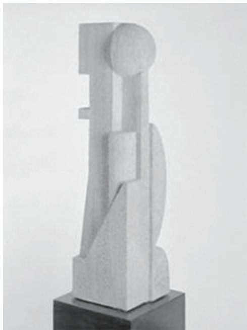
图1-26 | 用建筑塑料制作的“石膏质感电话听筒”雕塑