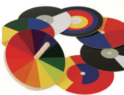
图1-23 | 包豪斯“光学混彩陀螺”的各种替换色彩卡片