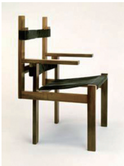
图1-25 | 用染黑羊毛制作木条椅的椅带

运用构成之间的各种关系也是影响立体构成的重要因素之一,如各要素之间的主从关系、比例关系、平衡关系、对比关系等,都会影响到立体构成的视觉效果。