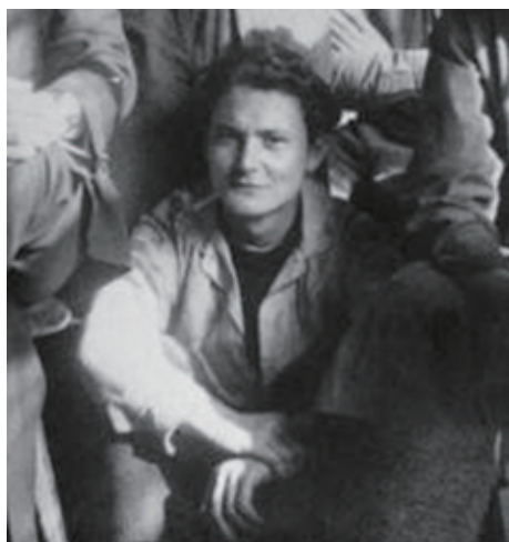
图1-13 | 威廉·华根菲尔德 (Wilhelm Wagenfeld)

出现在包豪斯魏玛时期 (1919—1925) 的 MT8 金属台灯,是包豪斯现代主义风格的代表作之一,如图 1-15、图 1-16 所示。那时华根菲尔德在魏玛包豪斯学院还只是学生,他和来自瑞士的卡尔 J. 尤克尔 (Karl J. Jucker, 1902—1997) 共同设计了这台灯。这个台灯不但造型简洁优美,功能实用,效果良好,并且充分利用了材料的特性:乳白的透明玻璃灯罩,金属质地的支架。因其零部件十分适用于大批量工业生产,这个现代主义风格的经典作品当年由莱比锡一家工厂生产,在市场上销售十分成功,直到今天依然在批量生产。