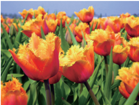
图1-1 | 美丽的鲜花

我们生活在一个三维空间的世界中,万事万物都具有一定的三维立体形态。不管是花园自由生长的郁金香花朵,还是人们无意中随意摆放的几个彩色缝纫线轴,它们都是具有一定造型特点的三维立体形态,在它们的造型中蕴含着大自然美的规律,如图1-1、图1-2所示。我们所要学习的立体构成这门学科,就是要对各种“三维形态”的共性问题加以研究,探讨如何将立体造型要素在三维空间中按照一定的原则,组合成富有个性的美的立体形态。