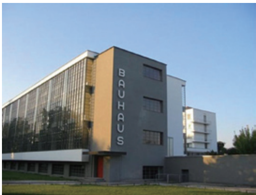
图1-6 | 包豪斯教学主楼外观

“构成”这一设计概念的产生源于德国的包豪斯造型艺术学院中,是德语 Gestaltung 一词的翻译语。德国国立包豪斯学校(国立建筑学院),如图 1-6 所示,德语全称叫做 Staatliches Bauhaus,通常人们都简称它为包豪斯(Bauhaus),它来自于德语动词“Bauen”(建造)和名词“Haus”(房屋)。包豪斯是世界上第一所完全为发展设计教育而建立的学院,也是世界现代设计的发源地,对世界艺术与设计的推动做出巨大的贡献。它的成立标志着现代设计的诞生,对世界现代设计的发展产生了深远的影响。