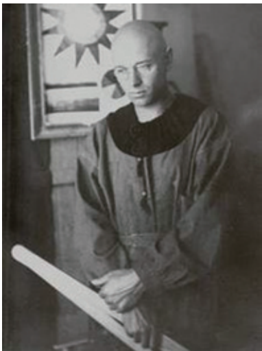
图1-8 | 约翰·伊顿 (Johannes Itten)

包豪斯对设计教育最大的贡献是基础课（Basic Course），最早将“构成”作为设计教学专门课程的是瑞士的约翰·伊顿（Johannes Itten，1888—1967）教授，如图 1-8 所示，他是画家、美术理论家和色彩学家，他的《设计与形态》和《色彩艺术》等著作开拓了构成艺术、促成构成教学占据包豪斯的主要地位，成为所有学生的必修课。伊顿提倡“从干中学”，即在理论研究的基础上，通过实际工作探讨形式、色彩、材料和质感，并把上述要素结合起来。伊顿开设构成课程的时期，正是世界工业设计和绘画艺术发展的一个关键时期。一方面，现代大工业的兴起，迫使人们思考 and 解决日益尖锐的工业生产方式和手工艺产品形式之间的矛盾；另一方面，现代绘画艺术从印象主义到抽象主义的巨大发展，在形式上又成为学校设计教学的一个重要基础，这也是包豪斯教学方法存留在现代设计教学中的一项重要硕果。甚至到现代的西方设计教学体系中的基础课程，从内容到教学方法，包括我国近年来引进的三大构成课程，都是从伊顿在 20 世纪 20 年代创立的基础课程上发展起来的。