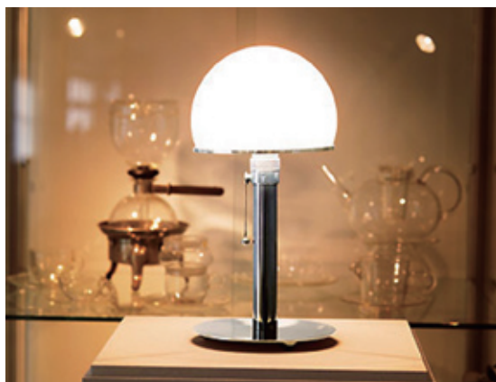
图1-15 | 华根菲尔德设计的 MT8 金属台灯 (1923—1924)