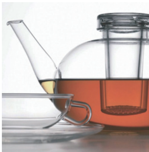
图1-18 | 华根菲尔德设计的过滤茶中的茶壶

包豪斯最有影响的设计出自纳吉负责的金属制品车间和布劳耶负责的家具车间。在包豪斯的家具车间,1928年期间马歇·布劳耶(Marcel Breuer, 1902—1981)创造了一系列影响极大的钢管椅(Wassily Chair(1925)),开辟了现代家具设计的新篇章。