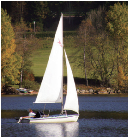
图1-5 | 现实中船的造型

立体构成包括了由二维平面形象转换为三维立体空间的构成表现。二维平面形象和三维立体空间之间既有联系又有区别。联系是：它们都是一