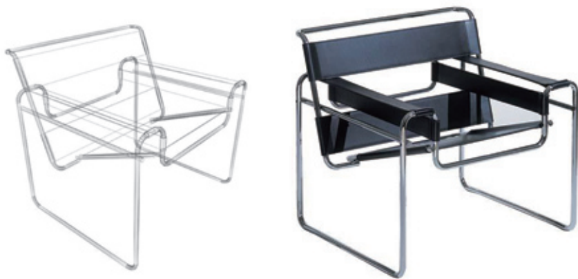
图1-21 | 钢管椅子内部构架结构和成品

几十年中包豪斯的设计思想和教育思想体系影响极为广泛。战后,包豪斯的部分教授到美国开设学校,他们对美国的设计教育产生了非常大的影响,所以美国在构成设计的形式上具有一定的包豪斯正统性,严谨中略带粗犷,以点、线、面为主,运用线的黑白对比,使视觉产生膨胀感。美国的现代设计由此得到巨大发展,至20世纪50年代,美国的建筑设计、工业设计和商业美术设计等都达到了世界一流水平。