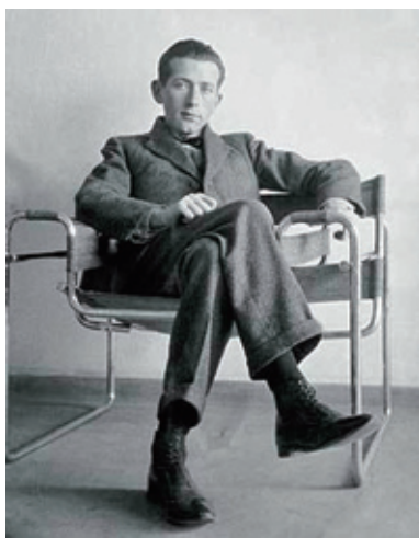
图1-19 | 马歇·布劳耶(Marcel Breuer)

子(Wassily Chair)就是这批家具中的一件,如图1-20、图1-21所示。他在受到自行车把手的启示后,设计出划时代的作品。这件作品中引入了他在包豪斯所受到的全部影响:其方型造型来自立体派,交叉的平面构图来自“风格派”,复杂的构架则来自结构主义。在其设计中充分利用新材料,首创和发明了世界钢管椅的设计。布劳耶相信工业化大生产,努力致力于家具与建筑部件的规范化与标准化,是一位真正的功能主义者和现代设计的先驱。尽管在谁先想到用钢管来制作家具这一点上尚有争议,但包豪斯首先实现了钢管家具的设想并进行了工业化生产却是没有疑义的。这些钢管椅充分利用了材料的特性,造型轻巧优雅,结构也很简单,成了现代设计的典型代表。“Wassily Chair”后来由世界许多厂家生产过,至今仍以各种变体形式被家具厂采用。这件作品对设计界的影响是划时代的,它不仅影响着以后的设计作品,而且影响着成百上千的其他设计师的作品。