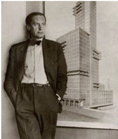
图1-7 | 包豪斯创建人 Walter Gropius

纳粹政权的威胁下被迫关闭。这期间共经历了三个时期:1919—1925年魏玛时期、1925—1932年德绍时期和1932—1933年柏林时期;以及三任校长:1919—1927年的沃尔特·格罗佩斯、1927—1930年的汉那士·梅耶(Hannes Meyer)以及1930—1933年的密斯·凡·得罗(Ludwig Mies van der Rohe)。当时的先锋派艺术家们因反对传统而推行现代艺术设计理念,可是由于世界大战和纳粹的关系,这所艺术学校陷入了危机,很多艺术家们因为不堪纳粹的排挤而逃亡到外国。而后这所大学在经历了几十年的沧桑后最终在两德统一后的1995—1996年间重新复名为魏玛包豪斯大学,并从一所设计学校成为著名的公立综合大学性质的设计学术机构。