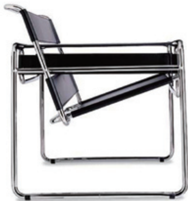
图1-20 | 布劳耶1928年设计的钢管椅子