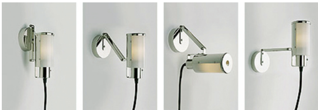
图1-14 | 华根菲尔德设计的镀铬钢管台灯可以用于多种角度照明