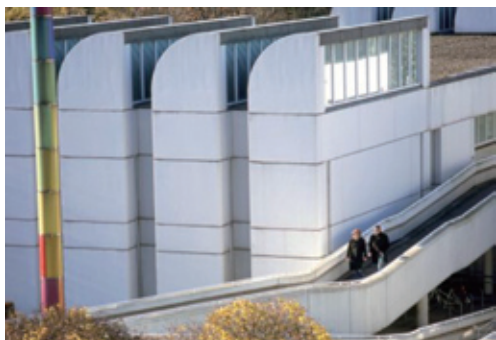
图1-11 | 包豪斯资料馆建筑物

在整个 20 世纪中曾涌现出很多设计风格,但似乎只有包豪斯的设计风格被世人公认为是真正的“现代主义”。在 20 世纪 20 年代包豪斯形成了现代建筑中的一个重要派别——现代主义建筑。包豪斯主张适应现代大工业生产和生活需要,讲求建筑功能、技术和经济效益。包豪斯校舍本身在建筑史上有重要地位,是现代建筑的杰作。它在功能处理上有分有合,关系明确,方便而实用;在构图上采用了灵活的不规则布局,建筑体型纵横错落,变化丰富;立面造型充分体现了新材料和新结构的特点,完全打破了古典主义的建筑设计传统,获得了简洁和清新的效果,如图 1-11 和图 1-12 所示。