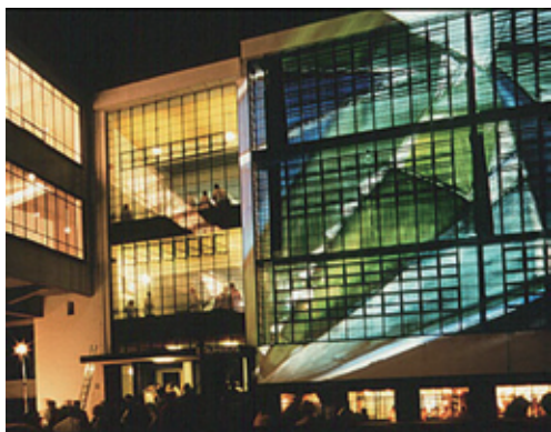
图1-12 | 包豪斯主教学楼夜间外观

由于包豪斯学校对于现代建筑学的深远影响,今日的包豪斯早已不单是指学校,而是其倡导的建筑流派或风格的统称。除了建筑领域之外,包豪斯在艺术、工业设计、平面设计、室内设计、现代戏剧、现代美术等领域上的发展都具有深远的影响。