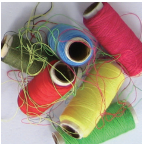
图1-2 | 随意摆放的彩色缝纫线轴

立体构成不仅是设计教育的主要基础课,而且也可以作为其他造型艺术的基础课来实践。立体构成不是以具象的客体为模特进行素描般的写生,而是将客体推到原始的起点,找出它的各种造型要素,然后按照一定的美的原则,同时渗入作者的主观感情,组合成为一种新的形态,简单地讲,就是一个打散与组合的过程。但这一过程必须遵循大自然的物理规律,因而我们的构成语言大多来自于自然,并通过设计者的思维体现于生活。