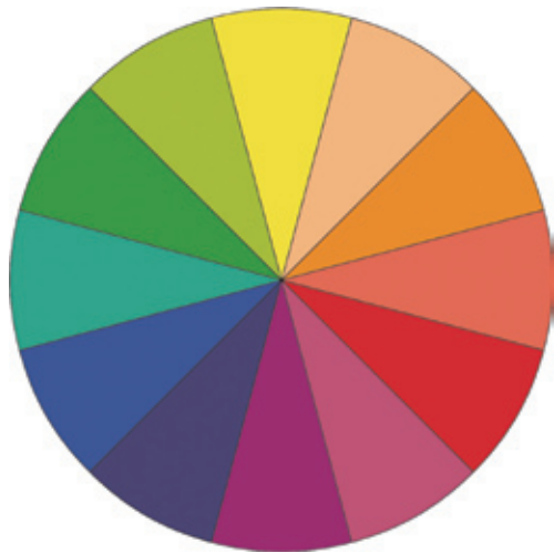
图1-22 | 12色相环

色陀螺,如图1-24所示。由此可知12色相环中看到的只是陀螺的一个面,而陀螺后面和侧面还有更多的轮廓,陀螺所有三维的这些形状组合到一起才是它的形态。只有掌握了这种空间思维的能力,才可以更好地完成立体到平面或者平面到立体的转换;才可以让好的设计从纸面上转化到现实中,形成具有实际意义的立体形态。