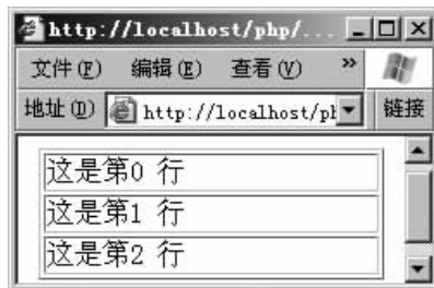
图 3-6 while 语句的应用