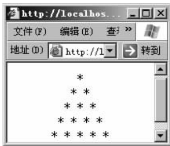
图 3-4 画金字塔程序

<div align = "center" > <? for($i=0; $i<5; $i++){ for($j=0; $j<= $i; $j++){ echo " * "; echo "<br/>"; } } ? > </div >