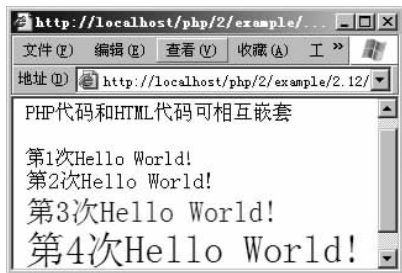
图 3-1 3-2. php 或 3-3. php 的运行结果

在 3-2. php 中, 由于 PHP 代码和 HTML 代码频繁地交替出现, 以致经常需要使用定界符关闭和开始一段 PHP 代码, 而如果把 HTML 代码当成字符串通过 PHP 程序来输出