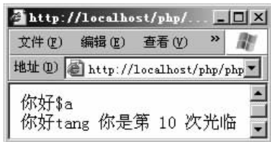
图 3-3 单引号字符串与双引号字符串

单引号表示包含的是纯粹的字符串;而双引号中可以包含字符串和变量名。双引号中如果包含变量名则会被当成变量,会自动被替换成变量值,单引号中的变量名则不会被当成变量,而是把变量名当成普通字符输出。示例代码如下,运行效果如图 3-3 所示。