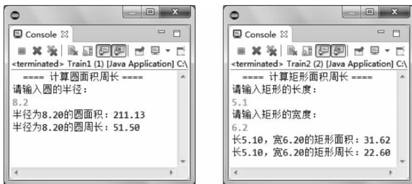
(a) 计算圆面积和周长