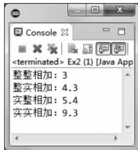
图 3-3 方法重载运行结果

注意: 可以重载一个方法的参数,但不能重载方法的返回类型,因为返回类型不构成方法签名。例如,不能在一个类中同时重载下面两个“方法”: