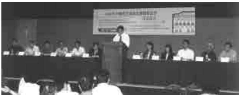
图 14 2000 年 7 月第七次研讨会会场(广州—澳门)

2000 年 7 月在广州和澳门召开的“2000 年中国近代建筑史国际研讨会”以“近代建筑与历史地段的保护再利用”为主题，接收论文 92 篇，其中有关近代建筑与历史地段研究保护的论文 37 篇，约 40% ① （图 14）；