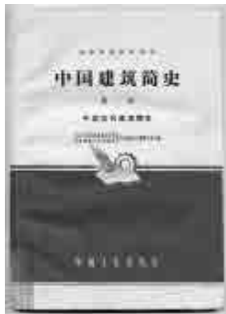
图2 中国近代建筑简史(1960)