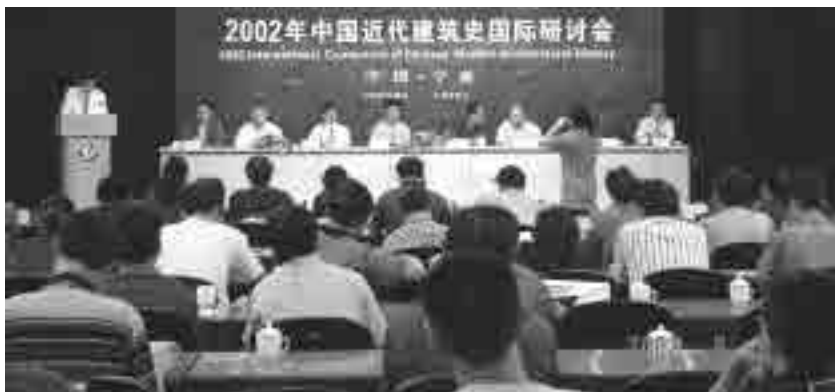
图 15 2002 年 7 月第八次研讨会会场(宁波)

2002 年 8 月在宁波召开的“2002 年中国近代建筑史国际研讨会”以“近代建筑保护与现代城市发展”为主题，接收论文 97 篇，其中有关现代城市发展中近代建筑保护与利用对策及手段的论文 22 篇，近四分之一 ② （图 15）；