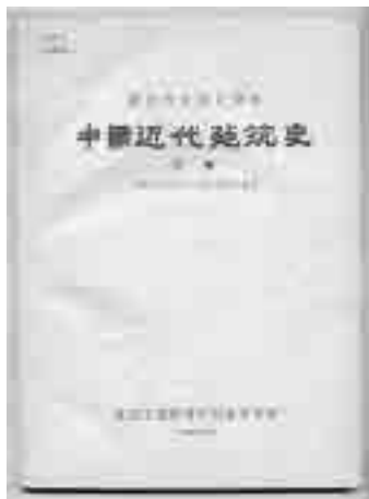
图1 中国近代建筑史(初稿)(1959)

1960年8月,全国“第四次建筑历史学术讨论会”后根据《中国近代建筑史》(初稿)缩编的《中国建筑史》第二册《中国近代建筑简史》,成为“高等学校教学用书”于1962年10月正式出版 ② (图2)。1964年在香港出版的徐敬直所著《中国建筑之古今》一书 ③ ,其中有“当代中国建筑”(Contemporary Chinese Architecture)部分,是关于中国近代建筑史研究的较重要的专著(图3)。