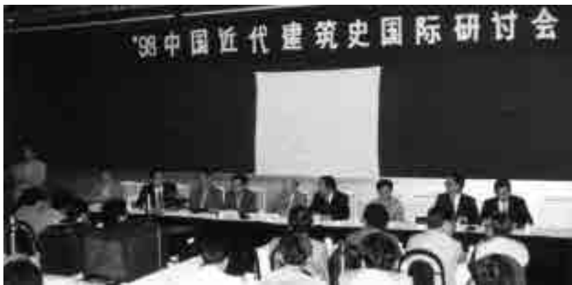
图 13 1998 年 10 月第六次研讨会会场(太原)

2000 年 7 月在广州和澳门召开的“2000 年中国近代建筑史国际研讨会”以“近代建筑与历史地段的保护再利用”为主题，接收论文 92 篇，其中有关近代建筑与历史地段研究保护的论文 37 篇，约 40% ① （图 14）；