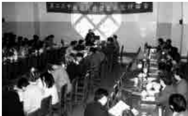
图8 1988年4月第二次研讨会会场(武汉)

1988年4月,“第二次中国近代建筑史研究讨论会”在武汉召开 ① (图8);1990年10月,“第三次中国近代建筑史研究讨论会”在大连召开 ② (图9)。