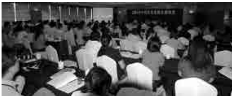
图16 2004年7月第九次研讨会会场(广东开平)

2004年7月在广东开平召开的“2004年中国近代建筑史研讨会”以“开平碉楼与中国近代建筑历史中乡土建筑的研究与保护”为主题,接收论文74篇,其中有关保护与利用的论文29篇,近40% ① (图16~图18)。