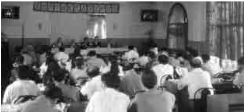
图 11 1996 年 9 月第五次研讨会会场（庐山）

1996 年 9 月在江西庐山召开的“第五届中国近代建筑史研究讨论会”接收论文 68 篇，其中关于近代建筑的保护与利用方面的论文 13 篇，占 19% ① （图 11，图 12）；