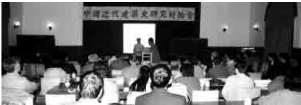
图4 1986年10月第一次研讨会会场(北京)

1986年10月，“中国近代建筑史研究讨论会”在北京召开。这是继“中国近代建筑史研究座谈会”之后，中国举行的第一次全国性研究中国近代建筑史的学术会议，是第二时期（新时期）中国近代建筑史研究正式起步的标志 ⑥ （图4）。