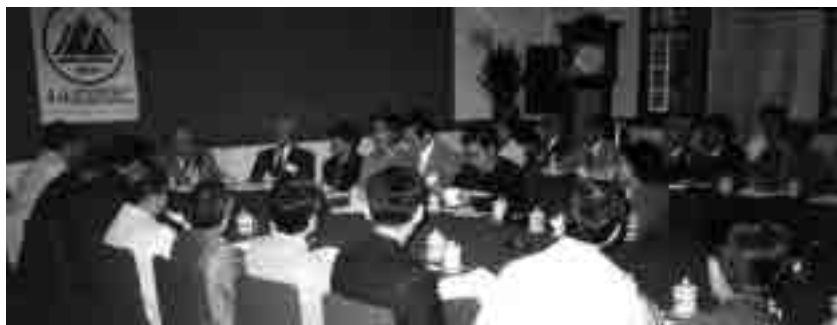
图10 1992年10月第四次研讨会会场(重庆)

1992年10月,“第四次中国近代建筑史研究讨论会”在重庆召开 ④ (图10)。