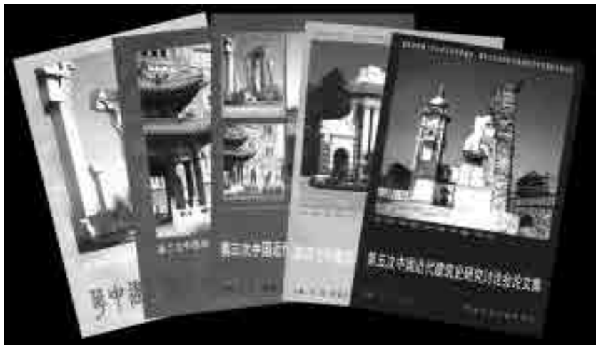
图 12 第一～五次研讨会论文集

1998 年 10 月在太原召开的“1998 年中国近代建筑史国际研讨会”接收论文 72 篇，其中涉及近代建筑保护与利用方面的论文 22 篇，占 31% ② （图 13）；