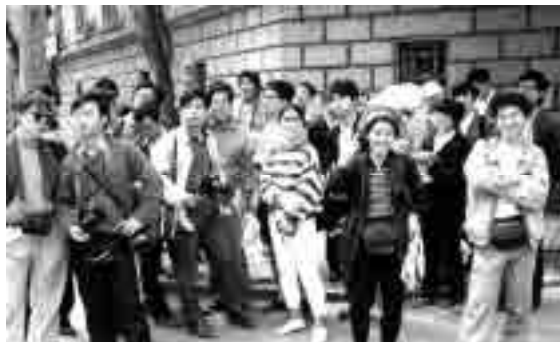
图5 天津讲习班考察(1988年5月)

1988年5月,“中国近代建筑讲习班”在天津举办(图5);1989年4月,中日合作在青岛、烟台联合进行主要近代建筑实测活动 ② (图6)。