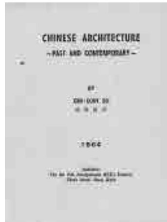
图3 中国建筑之古今(1964)

1979年7月,为国内高等学校建筑学专业中国建筑史课程的教学需要,编写了《中国建筑史》一书,其中“第二篇 中国近代建筑”基本为1962年《简史》的翻版,但大为简缩。其后,此书多次再版重印 ④ 。