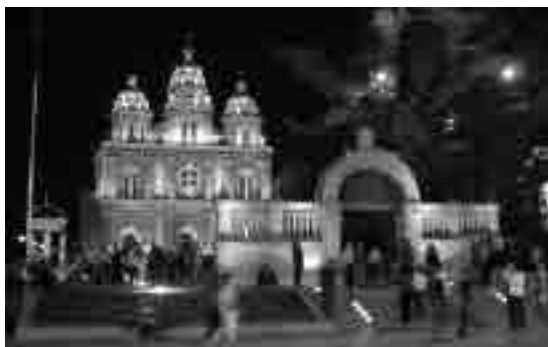
图21 北京王府井东堂修复及院门重建