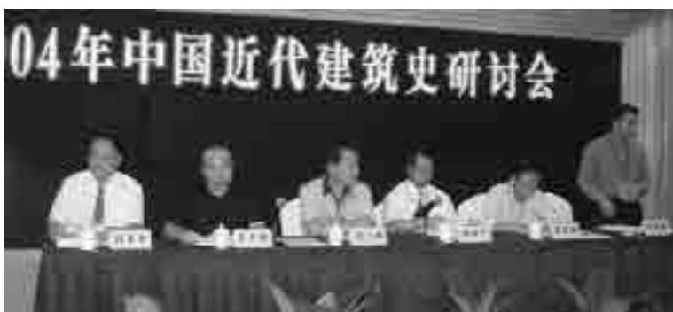
图17 第九次研讨会主席台