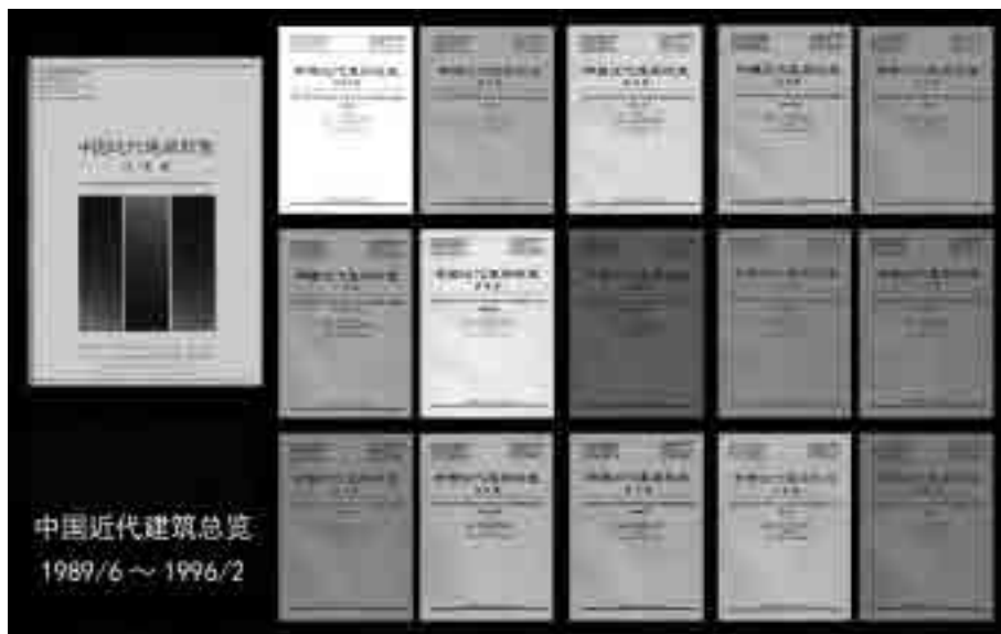
图7 《中国近代建筑总览》16分册

1989年6月,《中国近代建筑总览·天津篇》在东京问世 ③ ,标志中日合作取得了初步成果;1991年10月,中日合作进行了16个城市(地区)的近代建筑调查已全部完成,填制调查表2612份,中日合作取得圆满完成;至1996年2月,《中国近代建筑总览》出版16分册(参见附录1) ④ (图7)。