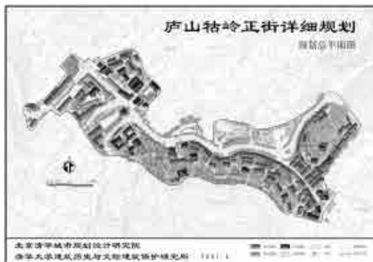
图 23 庐山牯岭正街保护修建性规划