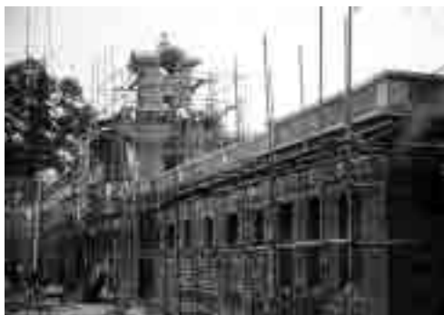
图20 原财政部印刷局中卫门翻建