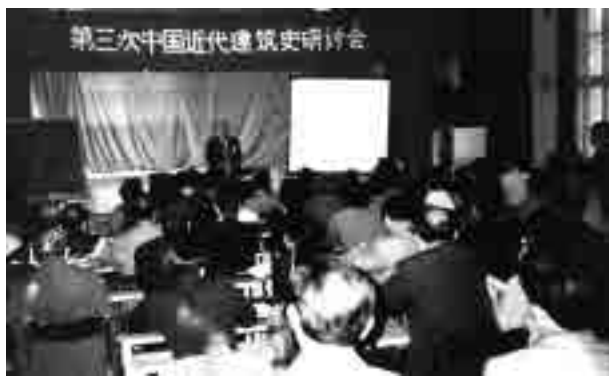
图9 1990年10月第三次研讨会会场(大连)

在第二、三次研讨会期间,1988年11月10日,建设部、文化部联合发出《关于重点调查、保护优秀近代建筑物的通知》,体现了在新的形势下,国家主管部门对近代建筑价值的认识和评价,并开始重视其保存与再利用问题。1991年3月,建设部城市规划司、国家文物局和中国建筑学会约集我国部分著名建筑专家和文物保护专家在北京召开“近代优秀建筑评议会”,并提出了《专家建议近代优秀建筑名单》 ③ 。