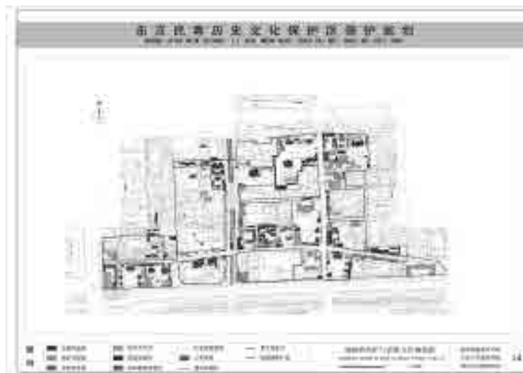
图 22 北京东交民巷历史文化保护区保护规划