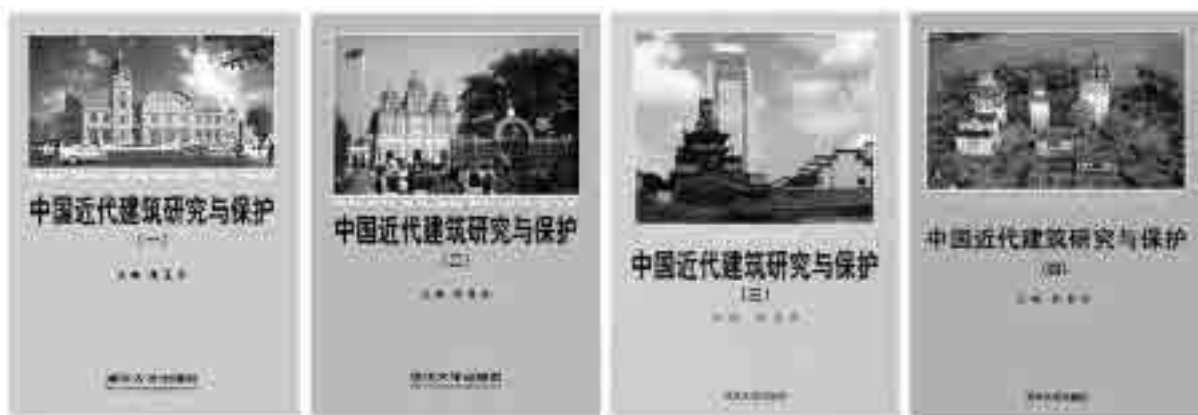
图18 《中国近代建筑研究与保护》学术丛书1~4辑

2006年7月在广西北海召开的“2006年中国近代建筑史国际研讨会”以“早期近代建筑与骑楼街道的研究保护”为主题,接收论文95篇,其中有关保护与利用的论文22篇,近1/4(参见附录2、3)。