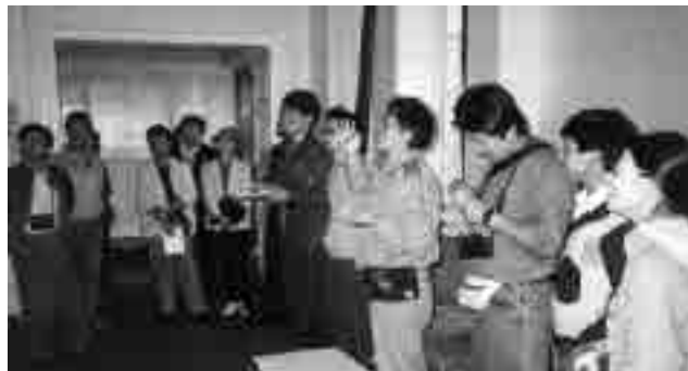
图6 青岛、烟台实测活动(1989年4月)

1989年6月,《中国近代建筑总览·天津篇》在东京问世 ③ ,标志中日合作取得了初步成果;1991年10月,中日合作进行了16个城市(地区)的近代建筑调查已全部完成,填制调查表2612份,中日合作取得圆满完成;至1996年2月,《中国近代建筑总览》出版16分册(参见附录1) ④ (图7)。