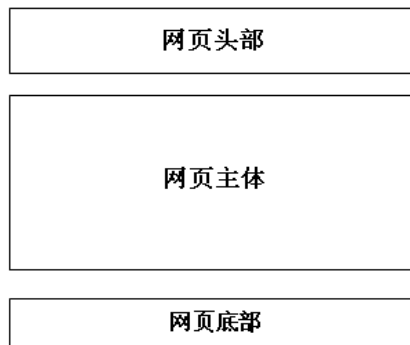
图 15-2 网页架构

本实例的电子商务网站整体上还是上中下架构，上部为网页头部、导航栏、热门搜索栏，中间为网页主要内容，下部为网站介绍及备案信息，如图 15-2 所示。