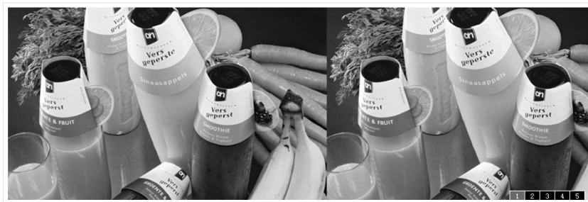
图 15-5 主体第二通栏