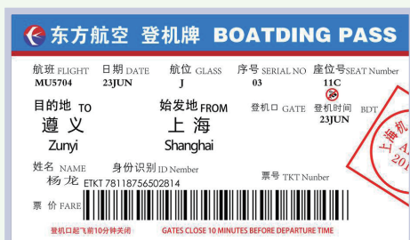
boarding pass / boarding card 登机牌