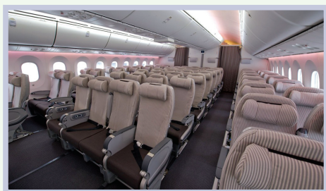
front row / middle seat / back seat