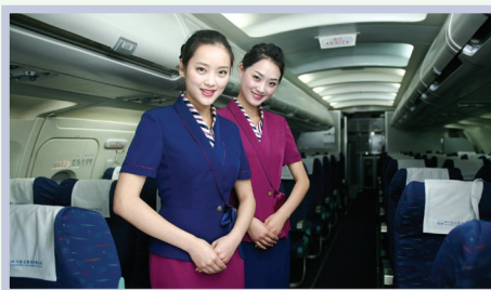
flight attendant 空姐，空少，空中乘务员