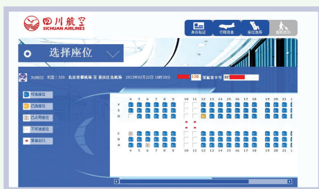
online seat selection 网上选座