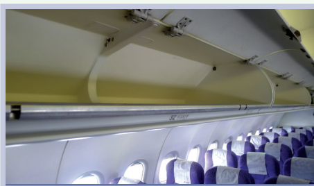
overhead compartment / overhead bin