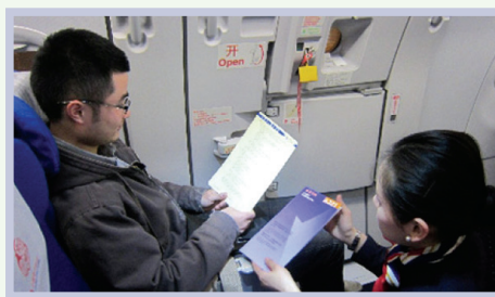
emergency exit row / exit seat 紧急出口旁的座位