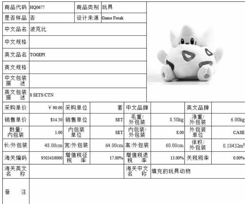
图 3-2 商品资料(波克比)