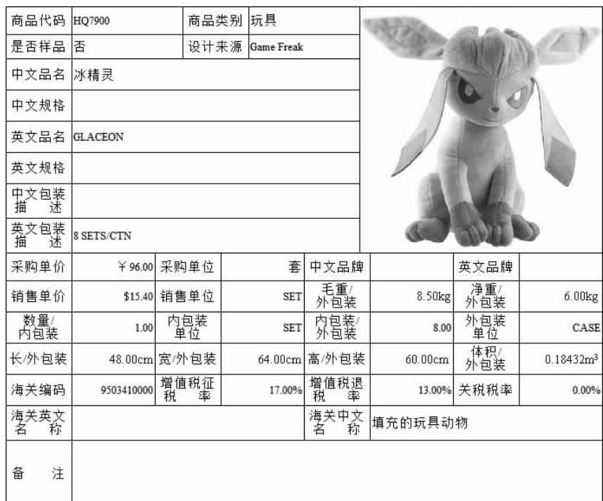
图 3-4 商品资料(冰精灵)