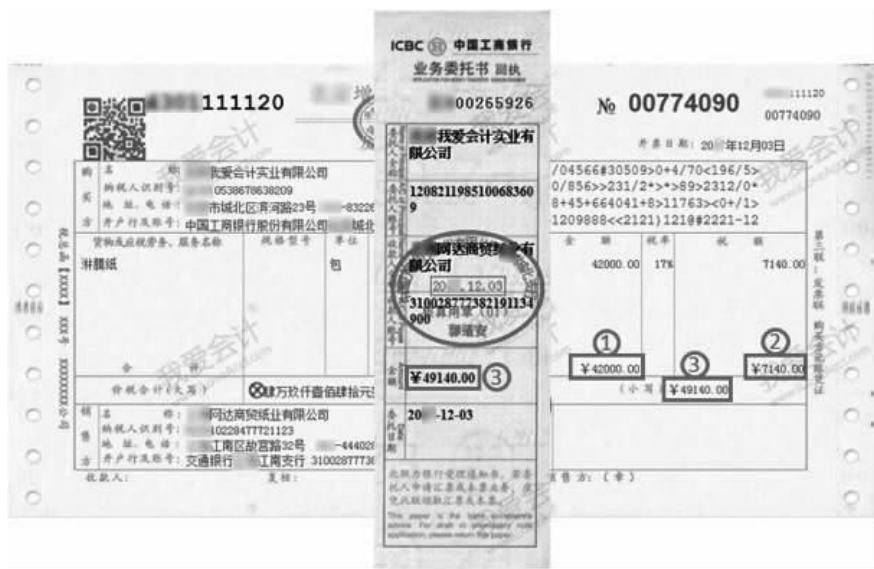
图 2-4 增值税专用发票和业务委托书回执

借：原材料——淋膜纸 42 000.00(图 2-4 中①处金额) 应交税费——应交增值税——进项税额 7 140.00(图 2-4 中②处金额) 贷：银行存款——工商银行城北支行 49 140.00(图 2-4 中③处金额)