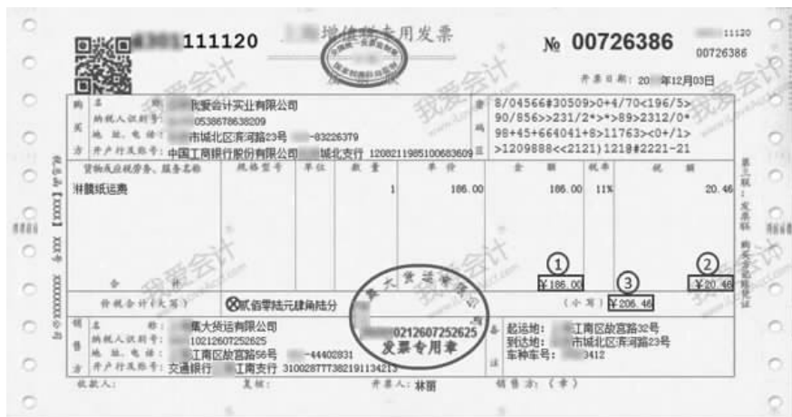
图 2-5 增值税专用发票

【例 2-2】 2017 年 12 月 3 日,北京我爱会计实业有限公司收到运输费发票(见图 2-5),运输费未支付。请会计人员据此做出账务处理。