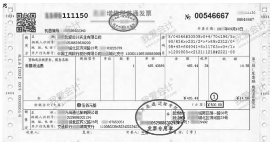
图 2-6 增值税普通发票

税务局申请代开的运输费发票。企业收到增值税专用发票(代开),应按照发票的不含税金额计入采购成本,按照发票的税额计入进项税额。