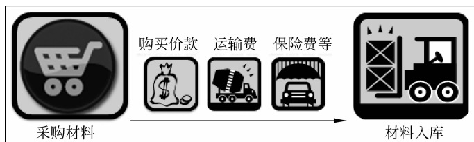
图 2-3 采购成本