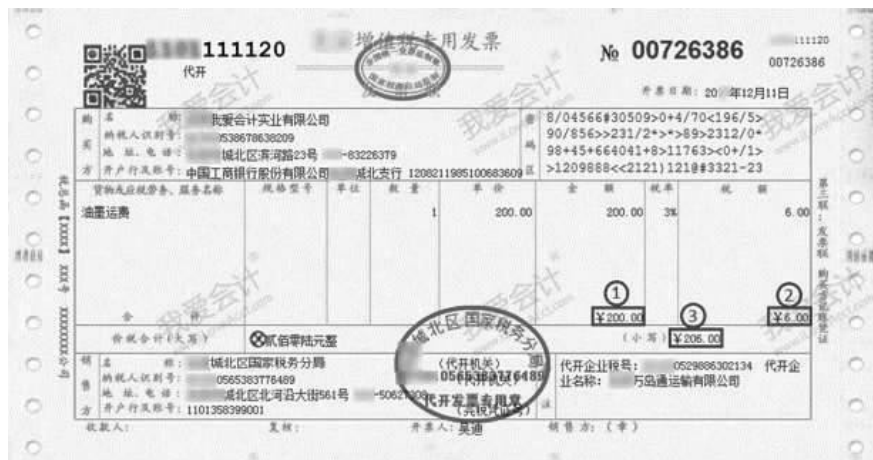
图 2-7 增值税专用发票(代开)

【例 2-4】 2017 年 12 月 11 日,北京我爱会计实业有限公司收到运输费发票(见图 2-7),运输费未支付。请会计人员据此做出账务处理。