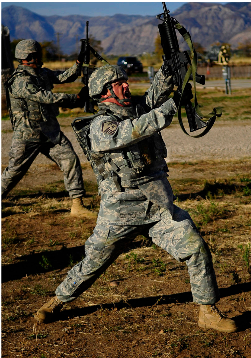
身穿 ABU 的美国飞行员