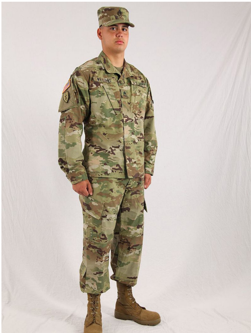
ACU 迷彩作战服穿着效果