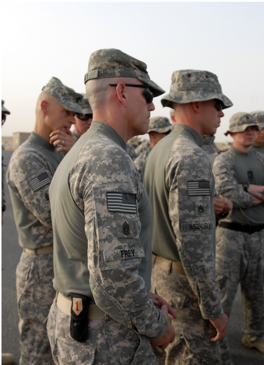
身穿 ACS 的美国陆军士兵