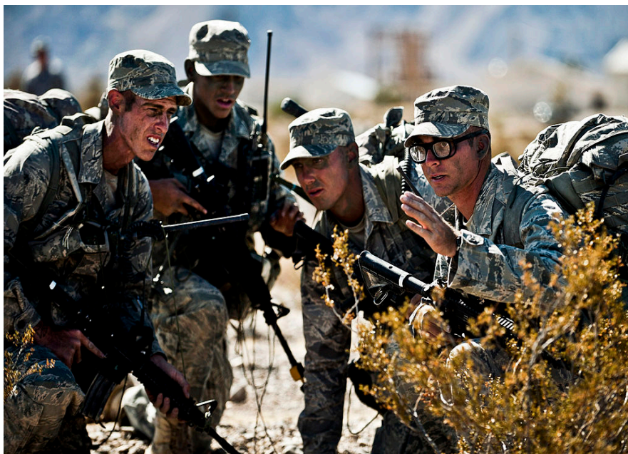
士兵身穿 ABU 参与作战训练