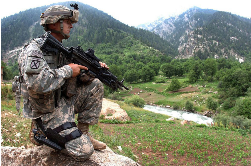
阿富汗战场上身穿 ACU 的士兵