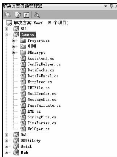
图 3-3 Common 中相关的一些类的操作

例如,其中 StringPlus.cs 文件中的 StringPlus 类就实现了字符串操作的相关方法,具体代码如下: