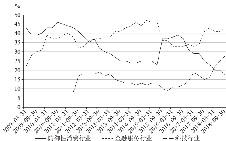
图 1.2 巴菲特 2009 年 3 月至 2018 年 9 月持仓的行业占比变化情况

因此，逆向投资中投资者在选股上要关注老百姓基本消费需求的方向，以巴菲特的投资为例，在 20 世纪 90 年代末开始的科技股大行情时，他一股科技股都没买，如图 1.2 所示，直到 2011 年开始买入首个科技股 IBM，然后在 2016 年开始买入苹果，在此之前巴菲特持有的行业主要是在防御性消费行业和金融服务行业。为什么巴菲特后面才开始买这些科技股？我的理解是，互联网泡沫时代，这些科技服务还并没有完全深入老百姓的生活中，只是作为一个新兴事物存在，随时都有可能倒掉或被替代，同时谁是龙头企业并不清晰，新兴行业通常有个规律就是赢家通吃，即最终龙头将占领多数的市场份额，其他的中小企业都会倒闭。而 2011 年时，互联网已经成为老百姓生活和工作的一部分，已经成为和吃饭、住房、开车一样必备的商品，同时龙头企业也已显现。其 2016 年买入苹果的时候也类似，智能手机已经成为每个人的必备，同时苹果的龙头地位也已非常明显。