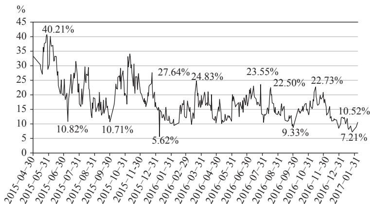
图 1.1 A 股 2015 年 4 月至 2017 年 1 月两融账户活跃度

因此，逆向投资并不是盲目地逆势而动，而是要顺势而为，只不过这个“势”是市场未来的发展方向，但它并未被市场上所有的参与者发现和认可。要看清这个“势”，就必须认真分析基本面，如本书随后所说的“要建立在认识周期的基础上”，认识宏观周期、行业周期以及公司的生命周期，避免倒在黎明前。