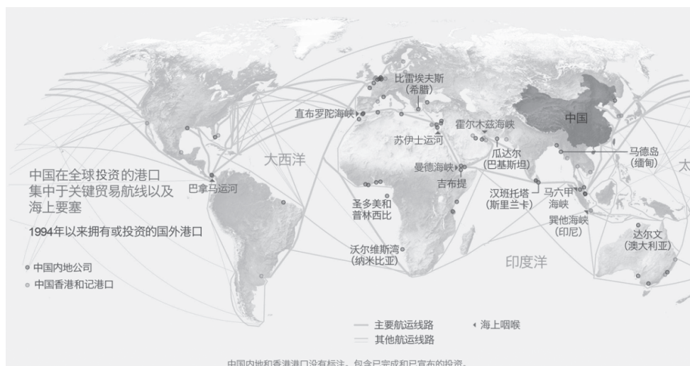
图 1.1 中国在全球投资的港口分布