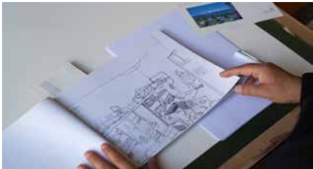
这是一个零基础的同学画的宿舍的场景。

其实基础训练阶段还提不到所谓“艺术”的高度，目的很简单，就是学会把对象画的比例恰当、造型准确。要达到这个目的唯一的方法就是多画多练，别无捷径。