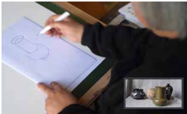
用纯粹的单线来练习，强调线条流畅，一笔到位。

素描零基础的同学经过一个学期的训练，进步都很大，造型能力也不断提高，但是一定要坚持不断地练习。