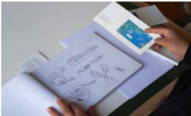
这是同学们画的一些简单的日常用品。

用一组静物做练习。建议大家用钢笔或签字笔来画，目的就是不能用橡皮涂改，以训练线条的肯定和果断。