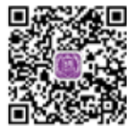
素描基础和练习方法

一般来说，素描应该是学习水彩画的先修课程。不过没有素描基础也没关系，初学者完全可以将学习水彩画和练习素描同时进行。