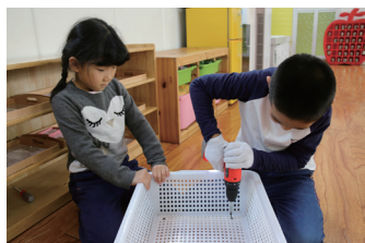
图 8-26 用电钻固定第二层筐

幼儿重新回顾了安装连接层的顺序，并运用流程图绘制了安装连接层的具体步骤：第一步是将角码固定在支柱上，第二步是将支柱固定在最底层，最后是将支柱固定在第二层筐上。有了前期安装经验的积累，幼儿在安装塑料筐与支架时很快掌握了方法。两次成功经验的积累让他们对自己充满了信心，对参与活动仍然保持浓厚的兴趣。