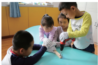
图 8-25 用电钻将角码固定在支柱上