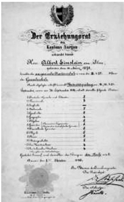
图 4.1 爱因斯坦 1896 年在中学补习一年后的成绩单。他在代数、几何、物理、历史分别得了 6 分，化学为 5 分