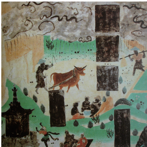
图 1-10 《雨中耕作图》，莫高窟第 23 窟，盛唐