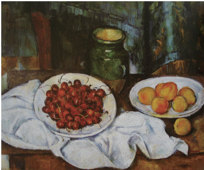
图 1-4 《樱桃和桃子》，保罗·塞尚

被誉为“现代艺术之父”的塞尚，就是在类似的徘徊间革新了人类对时空的艺术理解。塞尚不满印象主义对色彩的痴迷，认为这种绘画风格过分舍弃了对物象形态的描绘。他怀念古典绘画对现实世界的忠实，于是孜孜不倦地探索一种能够表现自然的绘画语言。如图 1-4 所示，面对一个个果盘、一只只花瓶，塞尚一边踱步一边寻找着物体最美的样态，竟在不知不觉间将“俯视”的果盘和“侧视”的花瓶集中在了同一个画面中。他极力写实的那种专注，无意中却颠覆了以往绘画遵循的单一视点原则。这种多视点的表达，还将“时间因素”引入绘画，人们可以沿着塞尚的视角，依次地观看画中的一切。从那个时候开始，绘画不再仅仅是空间的艺术，还具备了“时间性”。此后，现代人对于绘画的理解，对于现实世界的观看方式，都被改变了。