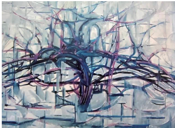
图 1-7 《灰色的树》，彼埃·蒙德里安