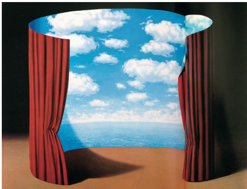
图1-5 《一个圣人的记忆》，马格利特

艺术家马格利特更加直观地诠释了“两个因素相加后产生新的因素”的力量。他经常将两个或多个不同的事物组合到一起,由此激发人们的无限联想——如图1-5,幕布拉开以后,是一片海阔天空的情景。马格利特的画特别神奇,他关注人作为一种生命体的潜意识领域,所以他的很多画是关于人的梦境的思考。我也教过一个爱做梦的学生,她每次梦醒,都会将自己梦到的场景画出来,并放到网上出售,慢慢地,她变得小有名气,也开始为他人记录梦境。这些关于梦境的创作或思考,在艺术史上被称作“超现实主义”,它引领我们触及现实生活的另一个领域,那个领域原本也是现实生活的一个重要组成部分,但却被我们忽视了。