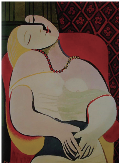
图 1-1 《梦》，巴勃罗·毕加索

反之，我个人也不乏为“已知”所累的经历，英语便是我的痛处之一。某次在国外讲学，走上讲台前，我内心惴惴不安，徘徊踱步。校长察觉到了我的异样，关切地问我有什么顾虑。我告诉对方，