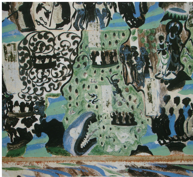
图 1-11 《法华经变之海上遇风难》局部，420 窟窟顶东坡右侧下部，隋

意的是，敦煌的部分魅力也在于她的偶然，在于被风吹、日晒等后天因素产生的岁月痕迹的神秘朦胧。再如，敦煌壁画中绘于北魏时期的《释迦牟尼舍身饲虎图》，其中同时包含释迦牟尼发现饿虎、纵身跃下、肉身被食等场面，这里面其实已经融入了时间因素。这与千年后西方现代艺术中的“多视点”构图表达，又何尝不是一种既“偶然”又“必然”的相遇呢？我们在观看这些绘画作品的同时，也关注了这些绘画中的文化因素、社会因素，它们也启发了我们思考先前未曾关注的问题，并拓展了我们的认知能力。