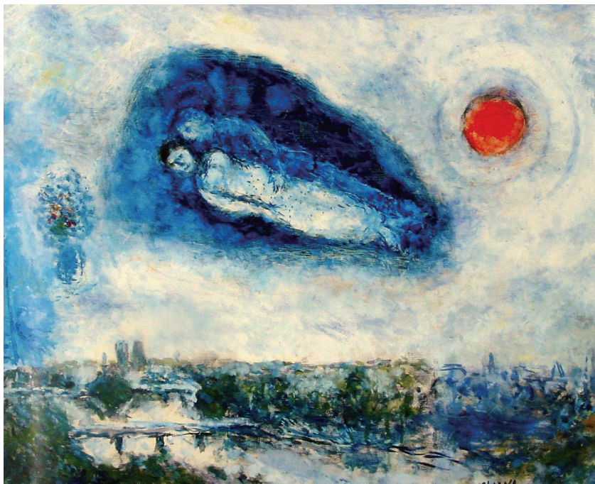
图1-3 《上空中的恋人》，马克·夏加尔

每个人都拥有属于自己的两个世界，一边是现实的世界，另一边是艺术（或是想象）的世界。懂得这种浪漫的人，将梦境活成现实，将艺术融入生活，然后又用艺术解释现实，将现实返还给了艺术。他们“不择手段”地用艺术表达情绪，“不择手段”地去探索与生活并行的艺术世界。艺术家夏加尔就是这样一位穿梭在梦境与现实之间的信徒，在他的作品（图1-3）中，恋人可以徜徉在城镇上空，与日月同辉，物象可以任由感情支配和重组。正如他的自述：“我不喜欢‘幻想’和‘象征主义’这类话，在我内心的世界，一切都是现实的，恐怕比我们目睹的世界更加现实。”他的内心世界或许