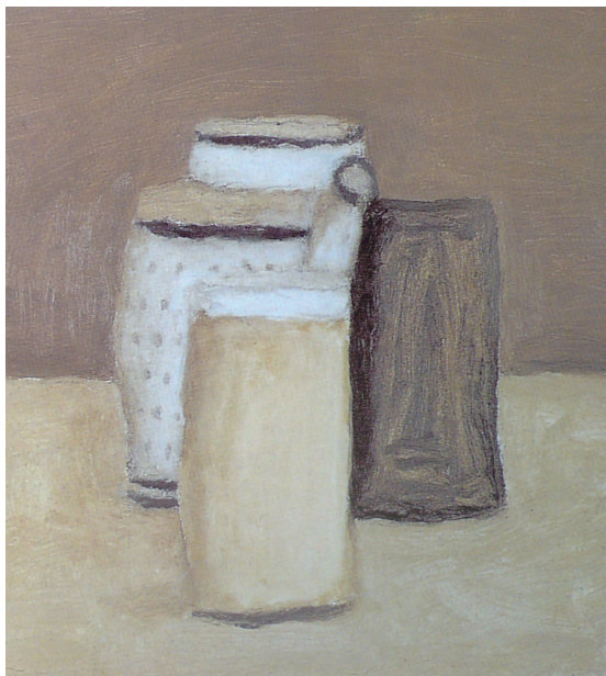
图 1-8 《静物》，乔治·莫兰迪

参考：[英]尼古拉·斯坦戈斯. 艺术与艺术家词典 [M]. 刘礼宾，代亭，沈莹，译. 北京：生活·读书·新知三联书店，2010：280.