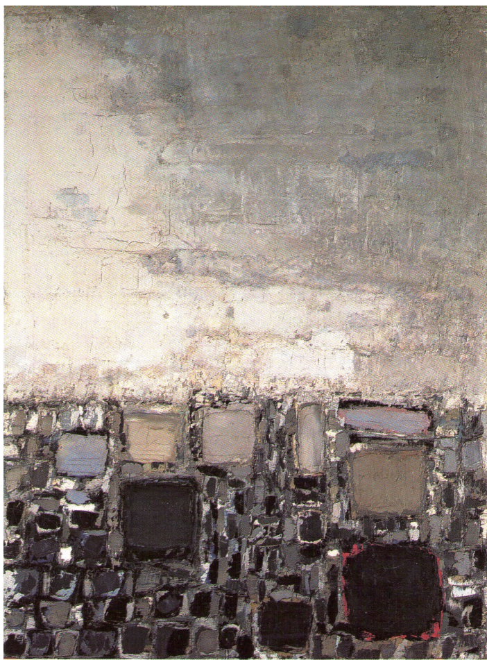
图 1-9 《屋顶》，尼古拉·德·斯塔埃尔

上, 是否存在着某种“理念”, 也就是基于每个人的观察思考而总结的“规律”。绘画探索和表达的就是这样的“规律”, 后者可以为更多的人借鉴和共享。就像这幅城市的“鸟瞰图”(图 1-9), 艺术家从看到的屋顶和天空中提炼出了某种“规律”, 并将之注入画面, 传达出他个人的“理念”。这种“规律”会反过来启发观看者去发现其他事物中的结构或节奏。而讨论“理念”的意义, 就隐藏在人们思考的差异中。