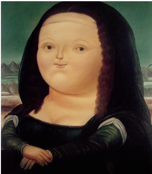
图 1-2 《蒙娜丽莎》，费尔南多·博特罗

艺术始终在拓宽和改变着人们的观看和理解方式，人类的历史也是我们的观看和理解方式不断改变的历史。我们在观察和描绘事物的过程中，比较和分析着纷至沓来各种各样的可能性，这些可能性都源自我们内心的感受，我们需要判断这些感受，以及判断我们是否还拥有感受的能力。