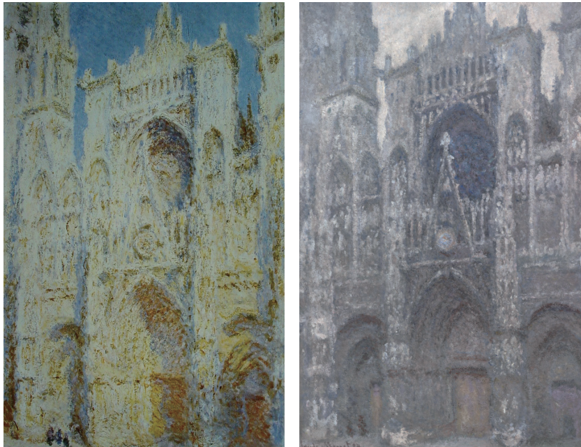
图 1-12 《鲁昂大教堂，西立面，阳光》，克劳德·莫奈

艺术家莫奈以“捕捉”光和影的色彩见长。如图 1-12 所示，他在表现鲁昂大教堂的时候，发现教堂在不同的时间和光线下呈现的色彩完全不同。于是，他画了很多幅教堂，每一幅教堂的颜色都因季节、因时间，甚至因他的心情的变化而变化，最终，竟没有任何两张教堂的颜色是完全相同的。从这个时候开始，人们意识到了，自然界原本根本没有固有的色彩，所有的色彩都会因主客观因素的变化而变化。也正因如此，印象派才建立起一套比较完整的认识色彩的方法。尽管这种绘画风格日后又被其他流派所挑战，但这仍然不能抹去印象派艺术家为人类绘画的历史所做的了不起的贡献。这些关于色彩的重新认知，就是基于艺术家们敏锐的发现能力而达成的。