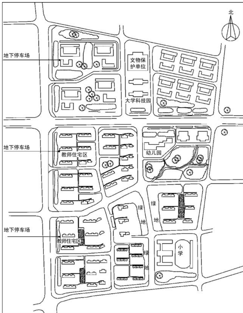
某市大学科技园及教师住宅区详细规划方案示意图