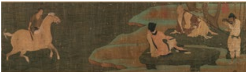
五代 佚名 神骏图卷