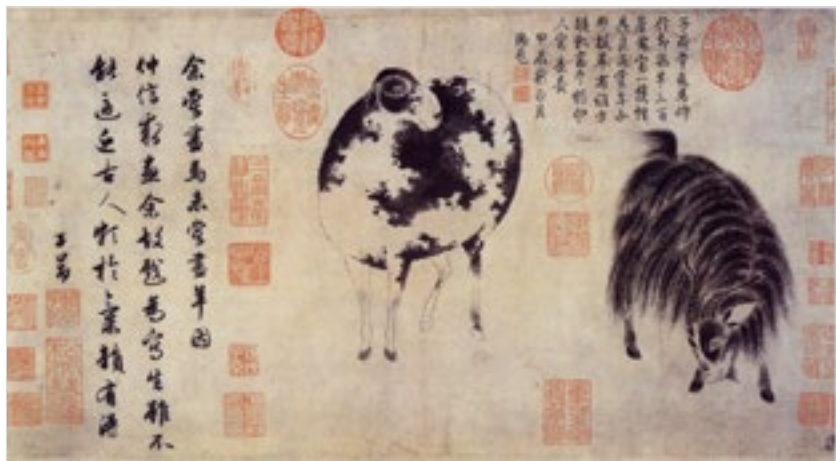
元 赵孟頫 二羊图