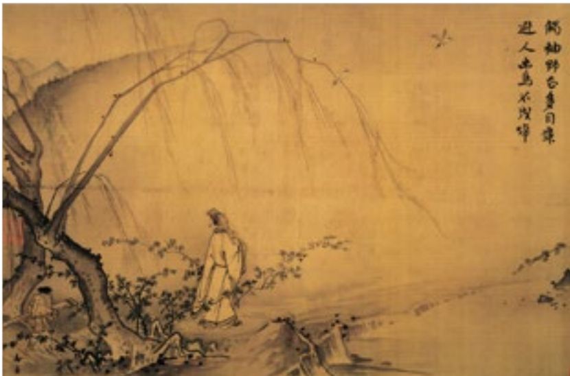
宋 马远 山径春行图

学士组成。民间绘画、宫廷绘画、士大夫绘画各成体系，但又互相渗透影响，使得宋代绘画异彩纷呈，呈现出不同于前代的独特风格，也产生了许多旷世杰作。