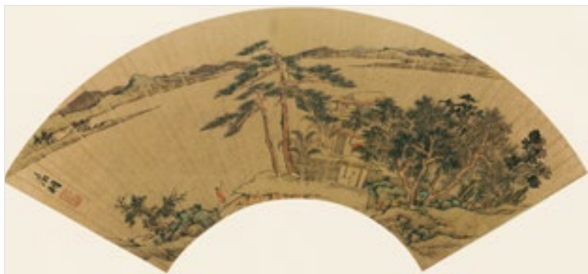
明 文徵明 扇面作品