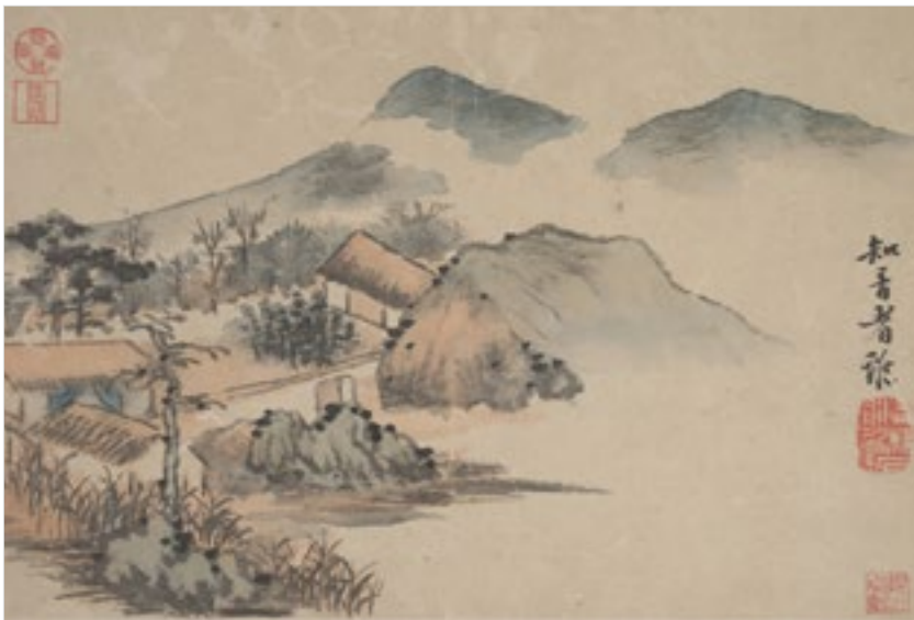
清 石涛 山水图册

清朝晚期社会动荡，文人画流派和皇室扶植的宫廷绘画逐步退出了时代舞台，开辟了通商口岸的上海和广州吸引了各方画家云集，出现了“海派”和“岭南画派”。