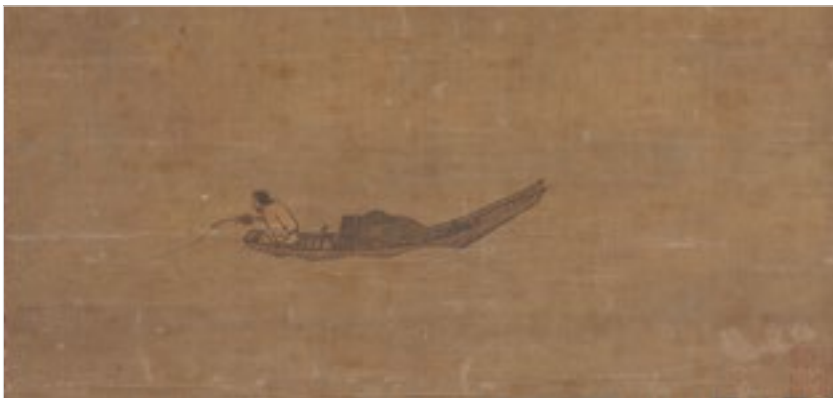
宋 马远 寒江独钓图

这幅《寒江独钓图》的内容看起来很简单，如果与柳宗元的《江雪》（千山鸟飞绝，万径人踪灭。孤舟蓑笠翁，独钓寒江雪）结合起来赏析，更能够感受到画中所蕴含的“清空寥旷，烟波浩渺”的意境。