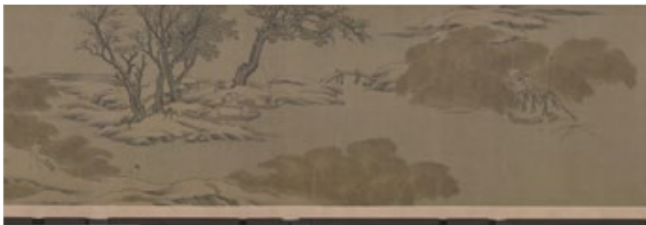
宋 佚名 雪渔图卷

意境神韵。 中国画强调意境和神韵，历代名家的画作都有一种意境美，这种对意境的表达使得中国画同时具备思想性和艺术性。