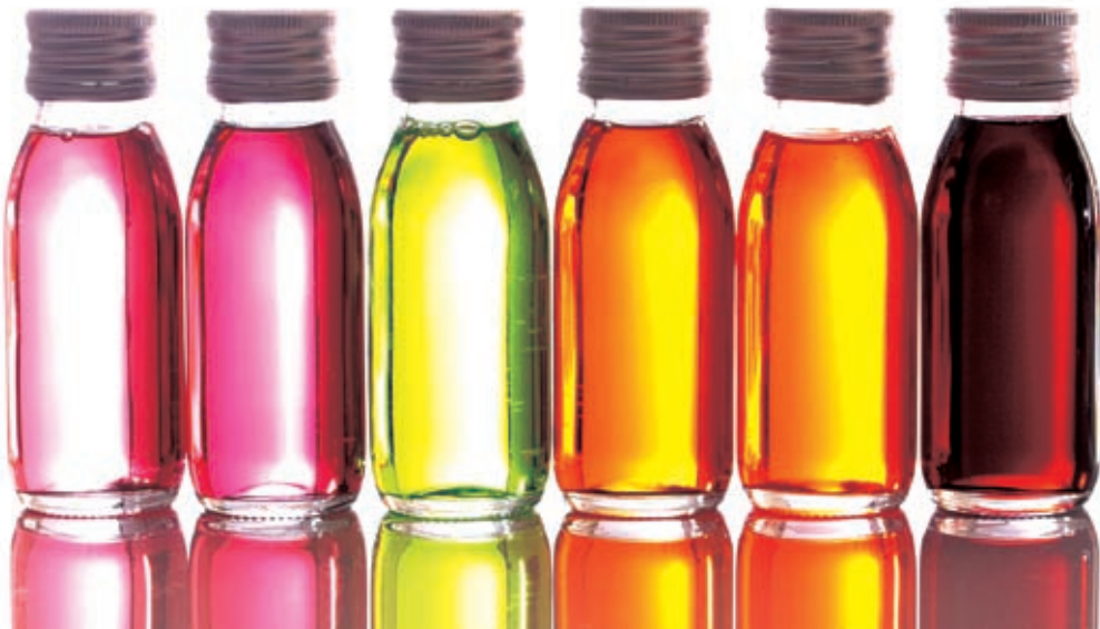
图2 裁切画面部分投影，打破呆板的上下对称构图，使画面形式更加自然，更有生气