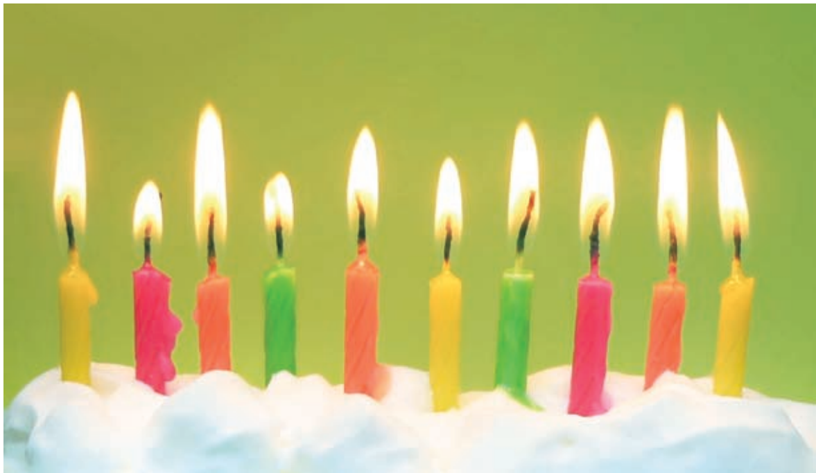
图2 剪裁画面使彩色的蜡烛高低不同的节奏更加突出，改善画面的整体构图效果