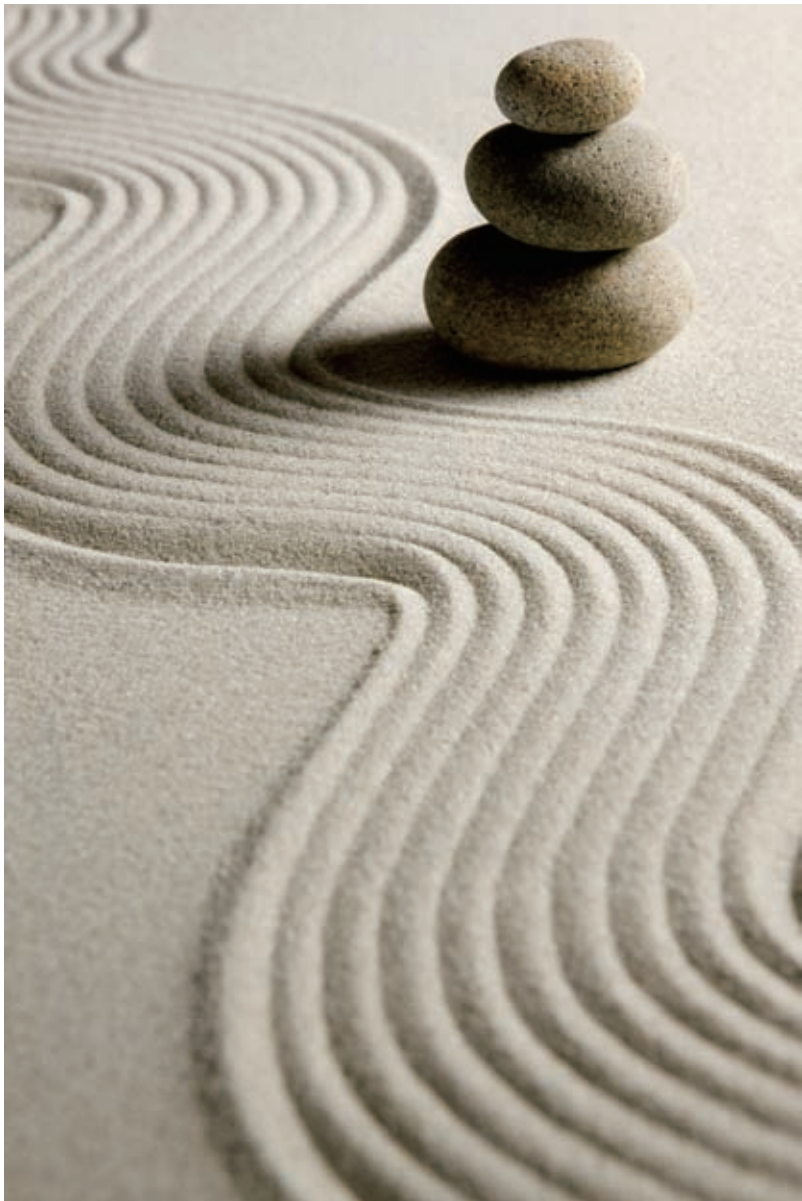
图1 重新构图调整后拍摄的画面

在重新拍摄时，在原有的基础上重新构图，使用竖画幅画面，从而留出大面积的前景来中和画面的视觉感，让画面得到均衡效果。在曝光上，增加1档曝光补偿，使画面看起来更加清新、唯美。在感光度的运用上，将自动白平衡调整为日光灯白平衡，从而增加画面的暖色调，给画面一种暖暖的视觉效果，从而削弱了砂石与石块的坚硬感，给画面以柔和感。调整效果如图1所示。