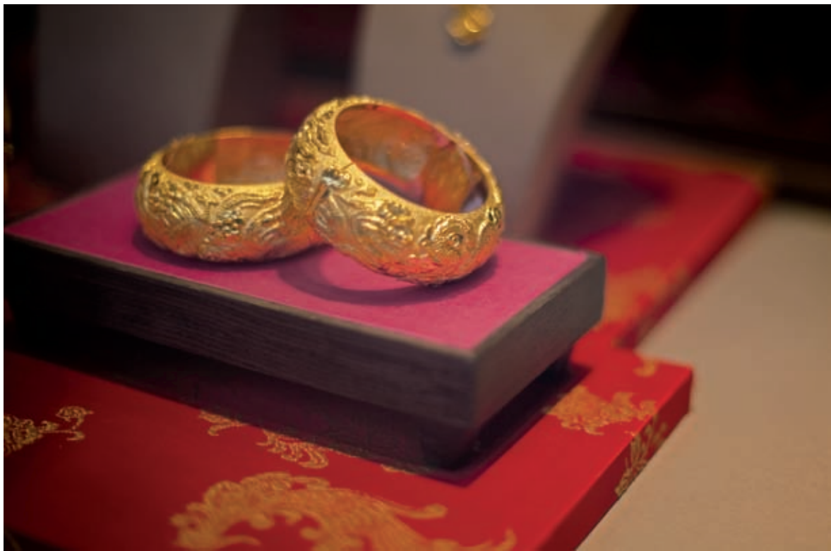
图2 对画面进行剪裁，使主体更加靠近黄金分割点的位置，构图均衡而且主体鲜明