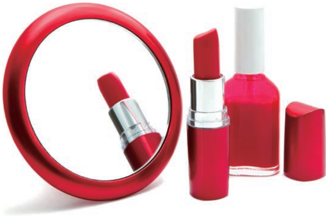
图1 增加画面元素，使用包围式布光拍摄的画面

在拍摄时，画面以单一红色作为最大亮点，并且增添了红色边框的镜子及红色的指甲油来丰富画面。另外还利用镜子的映像功能，巧妙地将直立的口红映入镜中，从而使画面更加丰富，富有趣味性。在布光方面，采用了包围式布光，以柔和的散射光作为画面的光源，并在左侧利用黑色吸光板为画面增加暗调，从而使拍摄主体具有明暗层次的变化。调整效果如图1所示。