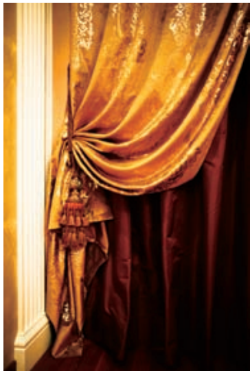
图1 调整画面的亮度与对比度展现暗部层次与细节