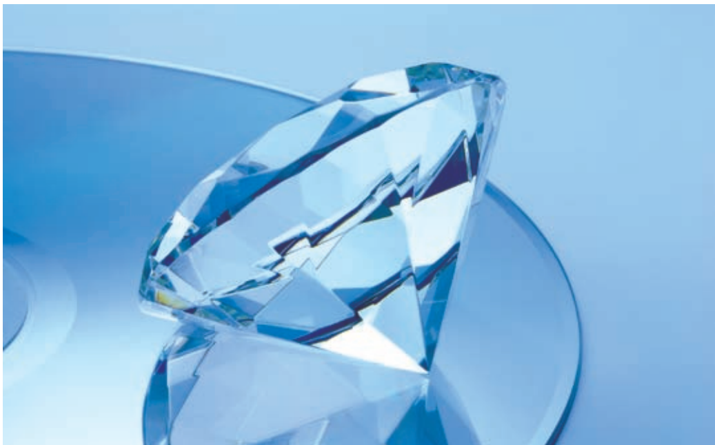
图2 选择单一的主体进行布光与拍摄