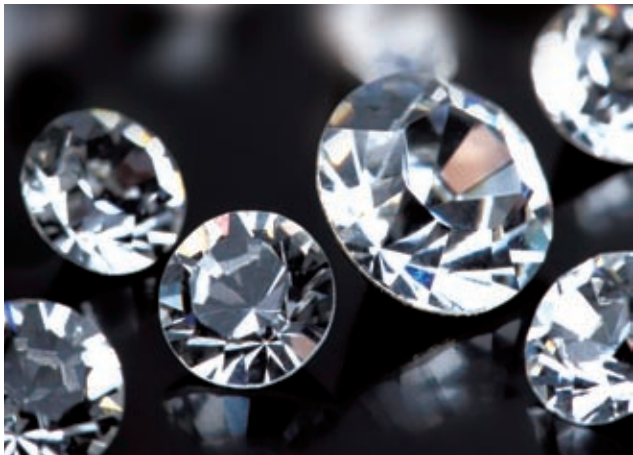
图1 调整画面的亮度与对比度，增强画面反差

❷ 取出单一的锥形水晶，对其进行布光，以光盘的光亮面作为衬托，并加以蓝色的滤光片，使画面高雅，且富有品质。调整效果如图2所示。