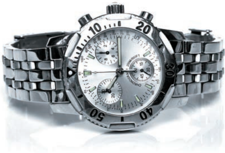
图2 剪裁画面，使手表的位置更接近画面的中心位置，从而使主体更突出