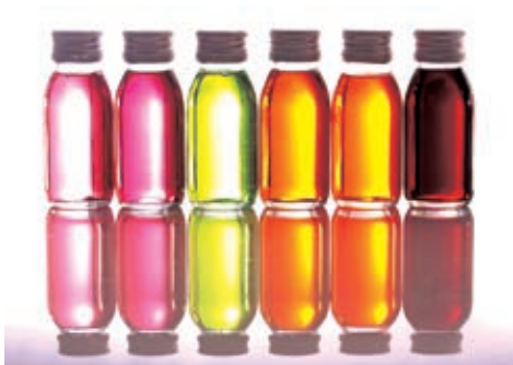
图1 通过后期降低画面亮度，突出玻璃瓶在逆光下漂亮的边缘轮廓

❷ 使用Photoshop软件中的“裁切工具”，裁除掉画面下方部分投影，打破画面呆板、单调的画面形式，使画面构图更加自然。