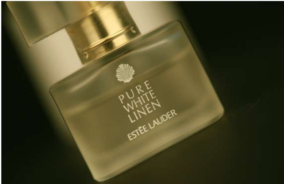
图2 使用倾斜的画面形式，增添动感和时尚气息