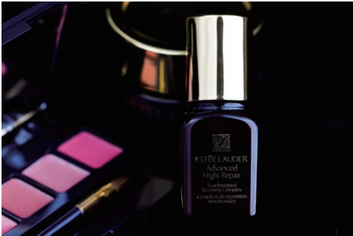
图1 变换角度，重新构图拍摄的画面

在拍摄时，重新放置拍摄主体、调整光位、变换角度，对拍摄主体进行进一步完善的拍摄，构图方式由竖构图更改为横构图，从而增加了画面的延伸效果，将陪体的作用发挥出来，利用陪体的色彩及形状来丰富画面，从而使画面不显得单调，在画面的右侧又单单留出1/3的空间，很好地避免了画面因为陪体过多的缘故而显得拥挤。而上下切割的方式，也使主体突显出来，而大光圈的运用，更进一步使画面前后层次鲜明，主体突出。调整效果如图1所示。