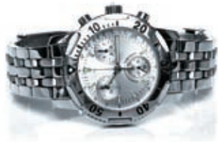
图1 调整画面的亮度和对比度，更好地展现手表的质感

❷ 裁掉底部区域，使手表更靠近画面的中间位置，更突出主体的细节，调整效果如图2所示。