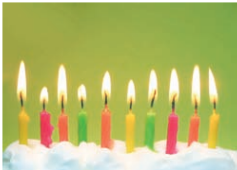
图1 提高画面的亮度与对比度，画面更加鲜明

② 裁剪画面上方区域，更近距离地展现高低的视差与白色物体的凸起节奏，整个画面的排列结构更加能够吸引观者的眼球。调整效果如图2所示。