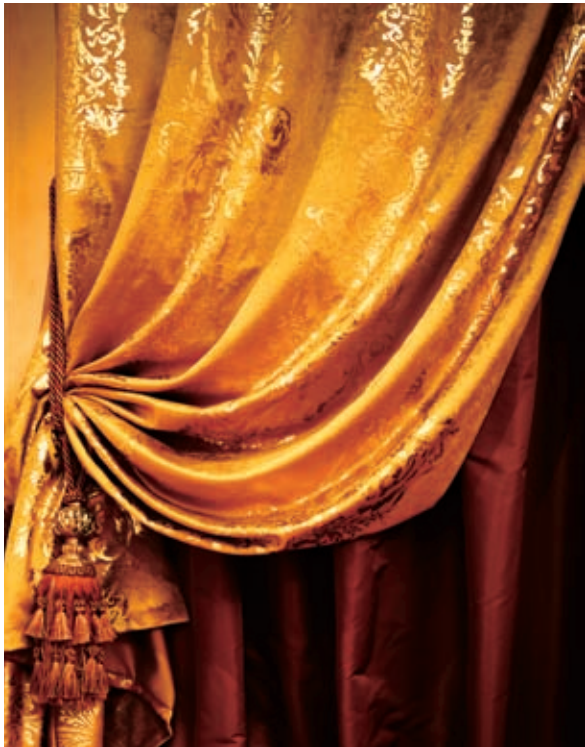
图3 剪裁画面，减少画面下部景物的面积，使主体更加突出

❸ 为了更加突出主体，更近距离的展现金黄色窗帘的细节与质感，剪裁下部的区域，调整效果如图3所示。