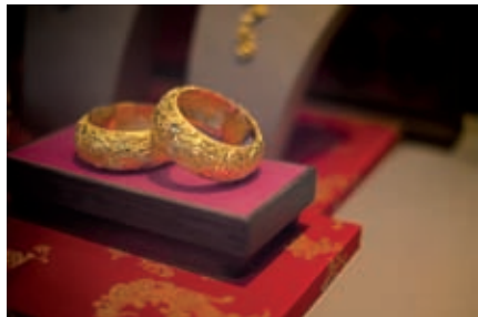
图1 调整高光区域突出首饰的色泽和质感

② 裁掉上部和右侧的部分区域，使首饰处于黄金分割点，使主体更加突出，调整效果如图2所示。