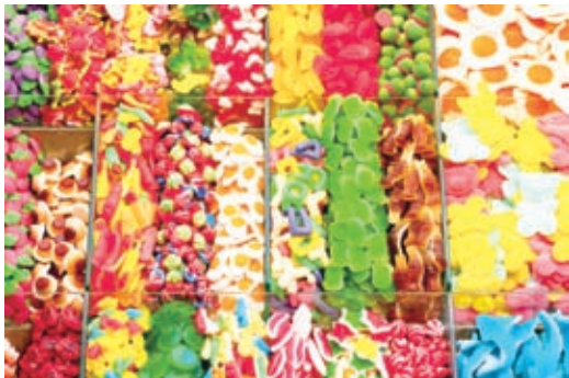
图1 调整画面的饱和度，使色彩更具有诱惑力

❷ 为了突显色彩的纯正艳丽，营造五彩缤纷效果，在Photoshop软件中执行“图像”>“调整”>“色彩平衡”命令，调整效果如图2所示。