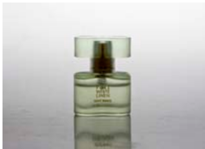
图1 增加暗部亮度，体现细节，突出玻璃材质的通透性

❷ 将香水倾斜摆放或倾斜相机拍摄得到倾斜构图的画面形式。这种构图一来改变了观者以往常规的欣赏模式，二来画面更具动感。对于香水而言，时尚气息浓厚。调整效果如图2所示。