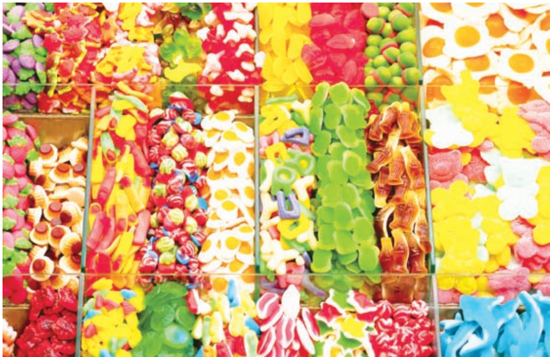
图2 调整画面整体的色彩平衡，使色彩更纯正艳丽，营造五彩缤纷的画面效果