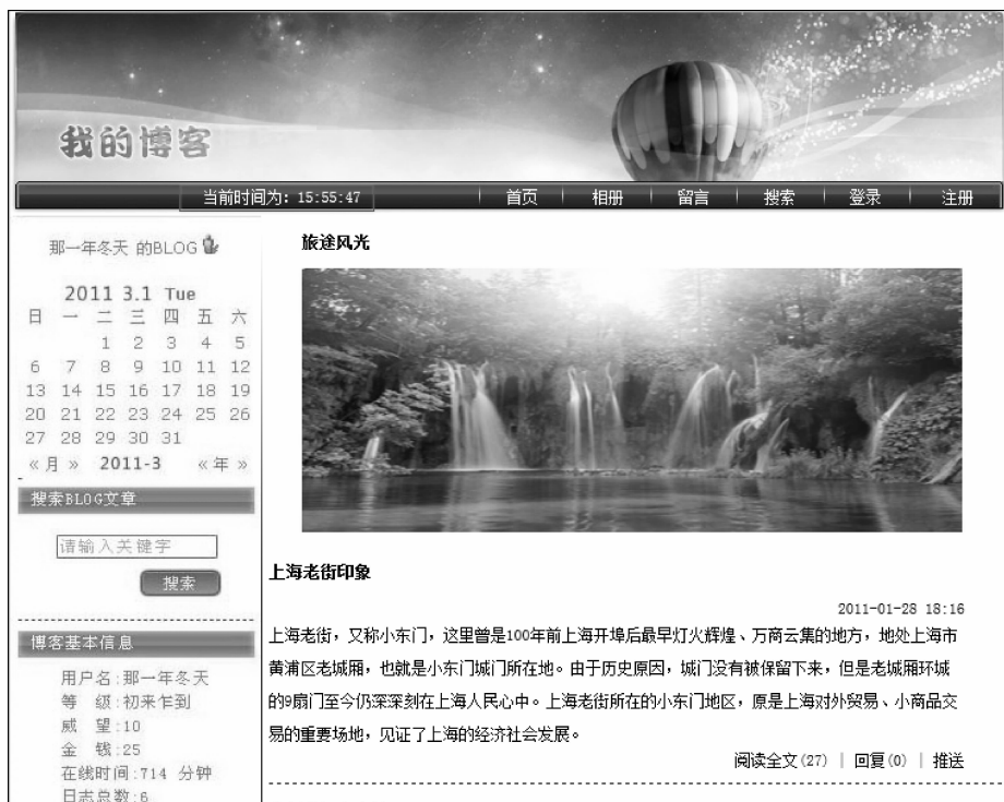
图 3-1 在首页显示动态时钟