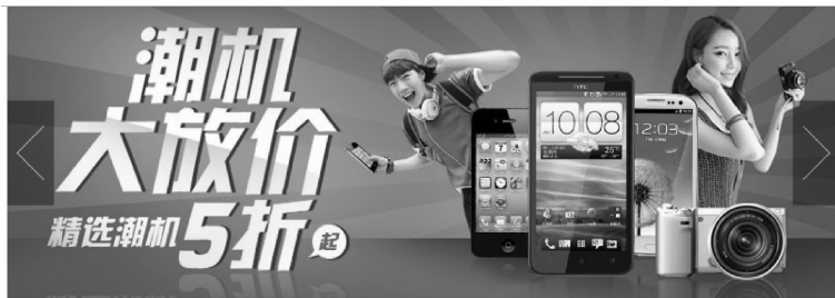
图 3-4 简单焦点图效果

焦点图效果是各大网站常用的效果,下面利用数组实现简单的焦点图效果,如图 3-4 所示,页面上 5 张图片 2 秒轮换显示,单击向右图片实现播放下一张图片,图片向后继续 2 秒轮换显示,单击向左图片实现播放上一张图片,图片向前继续 2 秒轮换显示。