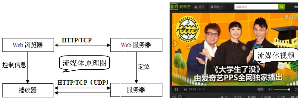
图 1-10 流媒体技术

流媒体是从英语 Streaming Media 翻译过来的，流媒体技术就是把连续的影像和声音信息经过压缩处理分成一个个压缩包，然后放到视频网站服务器，让用户一边下载一边观看、收听，而不需要等整个压缩文件下载到自己计算机后才可以观看的网络传输技术，如图 1-10 所示。流媒体技术对用户计算机系统缓存容量的需求大大降低，采用 RTSP 等实时传输协议，更加适应动画、视音频在网上的流式实时传输。