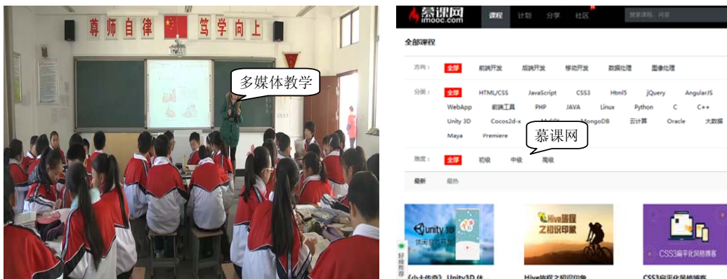
图 1-5 教育培训