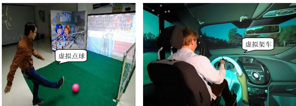
图 1-12 虚拟现实技术

虚拟现实(Virtual Reality, VR)是伴随多媒体技术发展起来的计算机新技术，它通过综合应用多媒体计算机的图像处理、模拟与仿真、传感、显示系统等技术及设备，以模拟仿真的方式，通过特殊的输入输出设备提供给用户一个与该虚拟世界相互作用的三维交互式用户界面，用户有漫游和操纵环境的物体感觉，如图 1-12 所示。虚拟现实技术始于军事和航空航天领域的需求，近年来已经被广泛应用于模拟汽车、飞机驾驶、工业建筑设计、医学、教育培训、文化娱乐等方面，也是今后若干年十分活跃的技术。