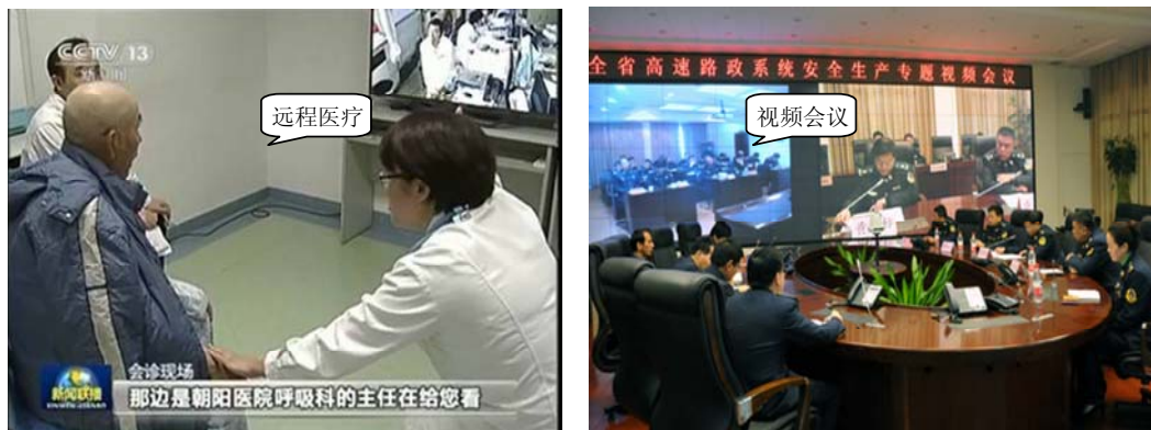
图 1-9 网络通信