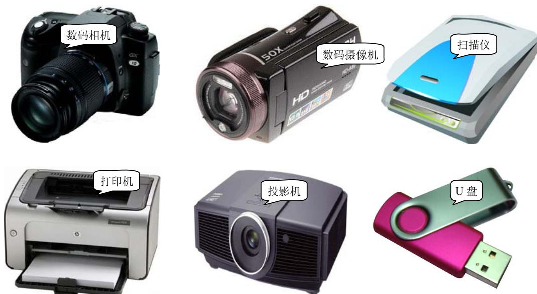
图 1-13 常见的多媒体硬件设备