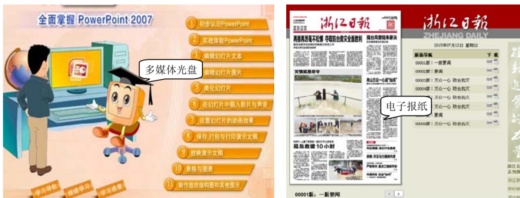
图 1-6 电子出版物

多媒体电子出版物是计算机、视频、通信、多媒体等高科技与现代出版业相结合的产物，是以电子数据的形式，把文字、图像、影像、声音等储存在光盘、网络等非纸张载体上，并通过电脑或网络来播放供人们阅读的出版物，如图 1-6 所示。它是一种顺应时代潮流的“绿色出版物”，与传统印刷品出版物相比，有如下优越性：①大大降低了出版物的成本，缩短了出版周期，增强了出版的时效性；②长久保存，存储信息量大；③检索便捷，交互式结构可实现读者的参与，超链接设置可拓展读者视野，可实现按需打印。