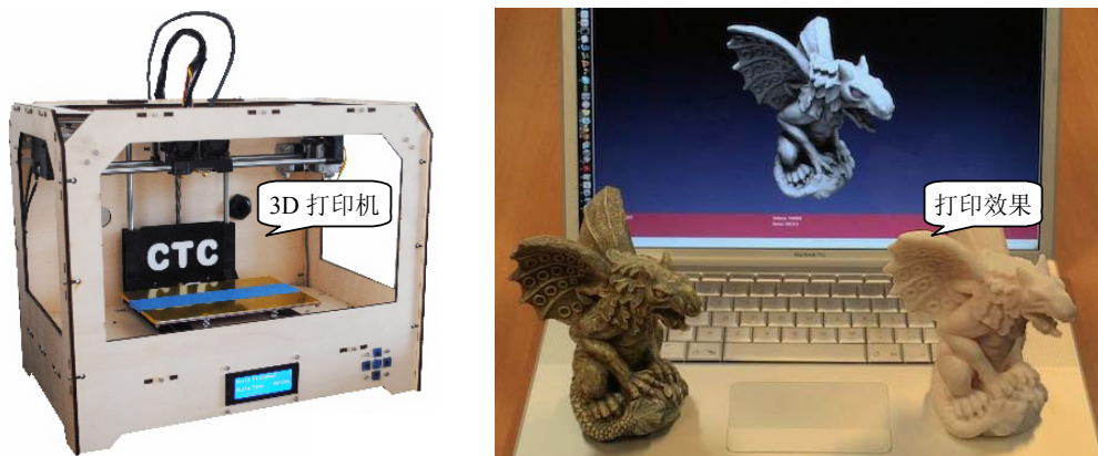
图 1-14 3D 打印机