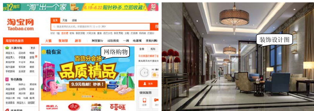
图 1-8 商业应用

建筑设计、产品设计、科学研究、机械设计、软件开发、工厂自动化等各个领域得到广泛应用。