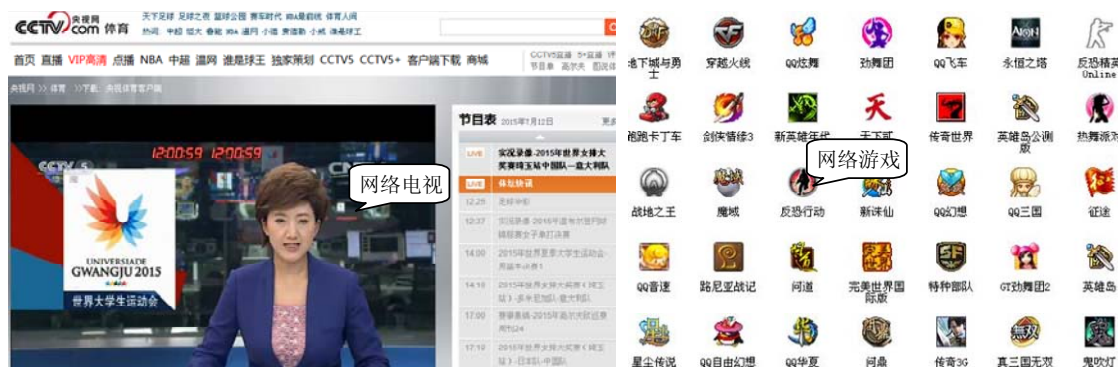
图 1-7 娱乐游戏

右图所示), 以互联网为传输媒介, 以游戏运营商服务器和用户计算机为处理终端, 以游戏客户端软件为信息交互窗口, 它不但具有很强的交互性, 而且人物造型逼真, 使人有身临其境的感觉。