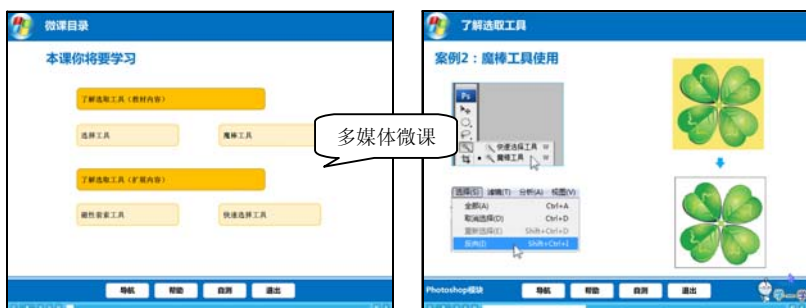
图 1-4 多媒体微课

在一个多媒体作品或应用软件里，都会包含以上媒体要素。如近年来，教师在教学中使用的多媒体微课(如图 1-4 所示)，能够有效地提升教学效率。