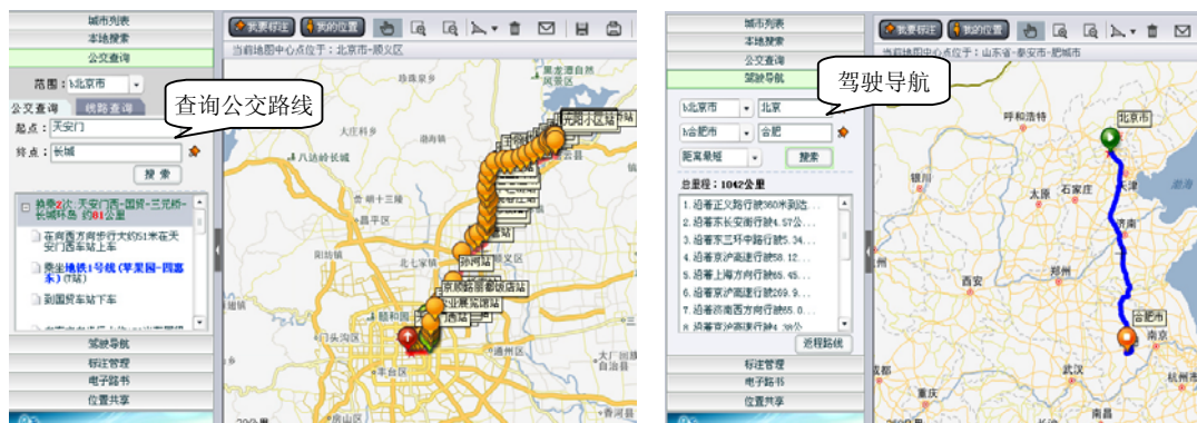
图 1-1 多媒体电子地图

人们现在普遍认为，多媒体技术就是利用计算机把文字、图像、动画、音频、视频等媒体信息都数字化，并将其整合在一定的交互式界面上，使计算机具有交互展示不同媒体形态的技术。如在多媒体电子地图里，集成了文字、图像、动画、音频和视频等媒体，可以提供公交路线查询、驾驶导航、位置共享等功能，如图 1-1 所示。