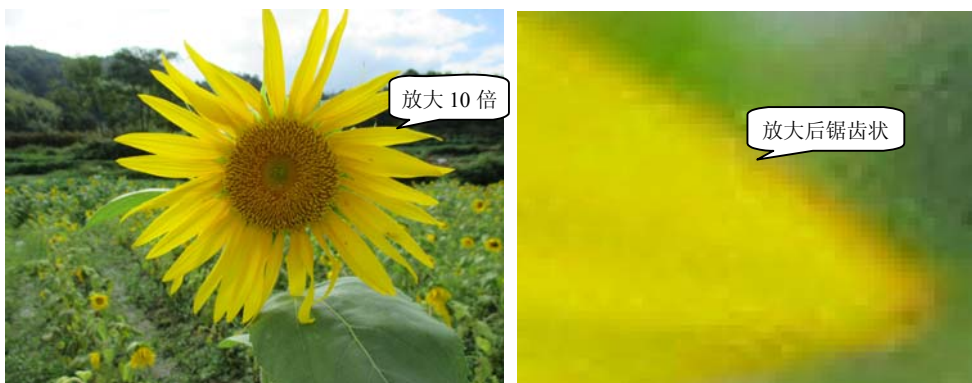
图 1-2 图像放大前后

图像即位图图像，它是由像素构成的，是对客观事物的一种相似性、生动性的描述或写真，是人类生活中最常用的媒体信息。一般而言，利用数码相机、扫描仪等输入设备获取的实际景物的图片都是图像。位图图像的像素之间没有内在联系，而且它的分辨率是固定的，如果在屏幕上对它们进行放大或低分辨率打印时，将丢失其中的细节并会出现锯齿状，如图 1-2 所示。图像的分辨率和表示颜色及亮度的位数越高，图像质量就越高，但图像存储空间也越大。图像文件在计算机中的存储格式有 jpg、bmp、tif 等。