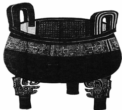
西周记载册命赏赐内容的大盂鼎