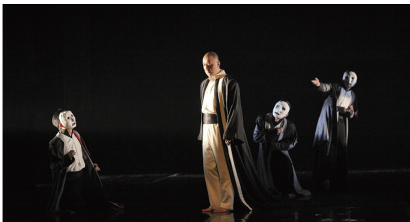
古希腊悲剧《俄狄浦斯王》剧照。

索福克勒斯，古希腊三大悲剧家之一。出身于兵器制造厂厂主家庭，生活于雅典极盛时期，是雅典民主派领袖伯里克利的朋友，曾任雅典税务委员会主席，被选为雅典十将军之一。他在艺术上的成就远远胜过政治上的业绩。他从事戏剧创作 60 多年，写了 120 多部剧本。获奖 24 次。目前流传完整的剧本只有 7 部悲剧。其中最著名的是《俄狄浦斯王》。