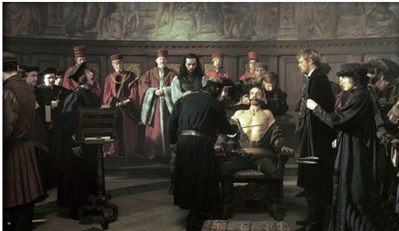
喜剧《威尼斯商人》剧照。

威廉·莎士比亚（1564—1616）是英国文艺复兴时期伟大的戏剧家和诗人。莎士比亚于1564年4月23日出生在英国中部斯特拉福德城一个富裕的市民家庭，幼年在家乡的文法学校念过书，学习拉丁文、文学和修辞学。