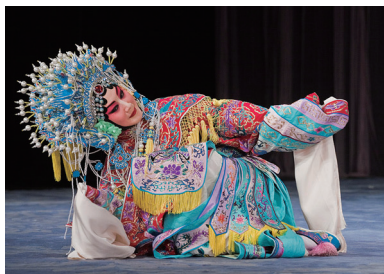
京剧《贵妃醉酒》剧照。