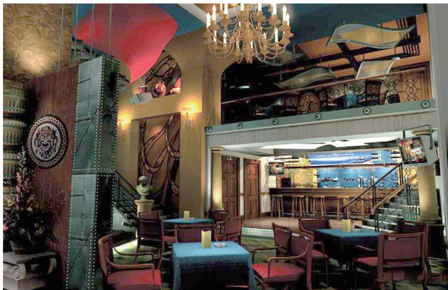
图1-5 酒吧的室内设计

综上所述,尽管专家们给出的定义不尽相同,但都指出室内设计与建筑的紧密关系(见图1-5),同时强调物质性与精神性,既具有实用功能,又满足人们的审美需求。这里给出以下定义:室内设计是根据建筑的使用要求,在建筑的内部展开;运用物质技术及艺术手段,设计出物质与精神、科学与艺术、理性与情感完美结合的理想场所;它不仅应具有使用价值,还要体现建筑风格、文化内涵、环境气氛等精神功能,如图1-6所示。