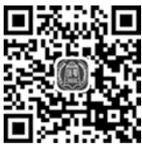
中药的起源和中药学的发展自测题及答案