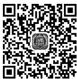
文学评论类型— 形态划分

(3) 机动体，是一种带有应试性、应激性、心得体会式的文学评论短论，如我们通常所说的读后感或者阅读鉴赏题等皆属于此类。这种样式往往只用于特别具体的作品，如一首诗歌、一篇散文、一篇杂文或者一种文学现象，有针对性地发表自己的体验感受和独特的理论见解。这种样式不需要枝蔓丛生，只需要点到为止，言简意赅。