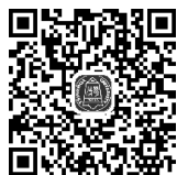
文学评论类型— 主体对象划分

文学评论是基于文学研究的一种常见的写作品体，也是一种应用型的文艺现象。由于划分的依据不同，文学评论也被划分成了不同的评论门类。