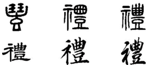
图 1-1 “礼”的不同写法

此，有“礼立于敬而源于祭”之说。应当说，中华民族的历史掀开第一页的时候，礼仪就伴随着人的活动，随着原始宗教而产生了。礼仪制度正是为了处理人与神、人与鬼、人与人的三大关系而制定出来的。中国古代有“五礼”之说，祭祀之事为吉礼，冠婚之事为嘉礼，宾客之事为宾礼，军旅之事为军礼，丧葬之事为凶礼，如图 1-1 所示。