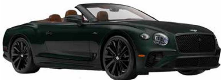
宾利欧陆 GT (2022 年款)