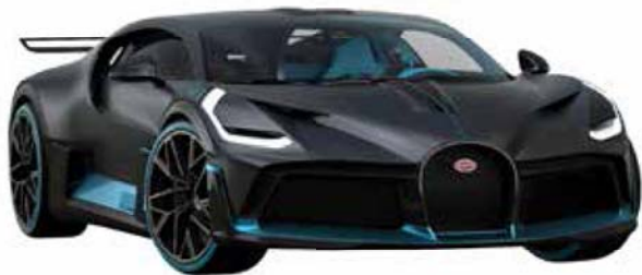
布加迪迪沃（2019 年上市）