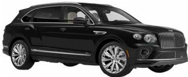
宾利添越 (2023 年款)