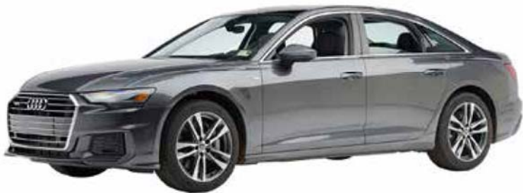
奥迪 A6L（2022 年款）