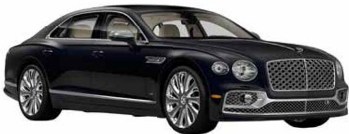
宾利飞驰 (2022 年款)