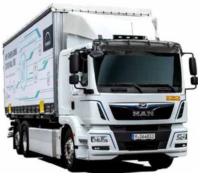
曼恩 eTGM 电动卡车