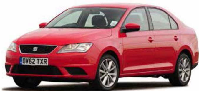
西亚特托雷多（2018 年款）