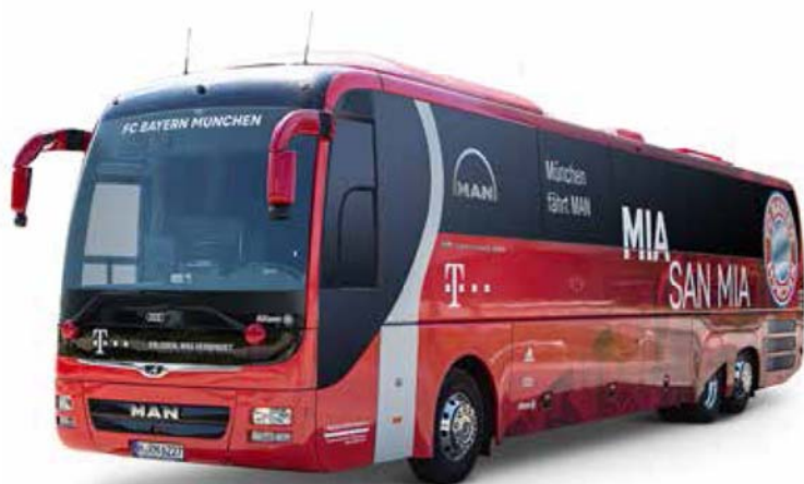
曼恩 Lion's coach 客车