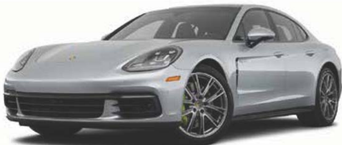
保时捷帕拉梅拉(2021 年款)