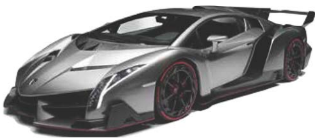
兰博基尼毒药（2013 年款）