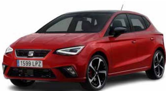
西亚特伊维萨（2023 年款）