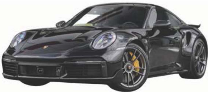
保时捷 911(2020 年款)