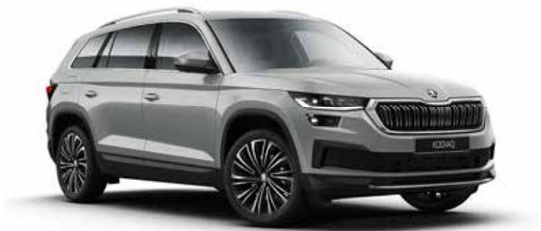
斯柯达柯珞克（2023 年款）