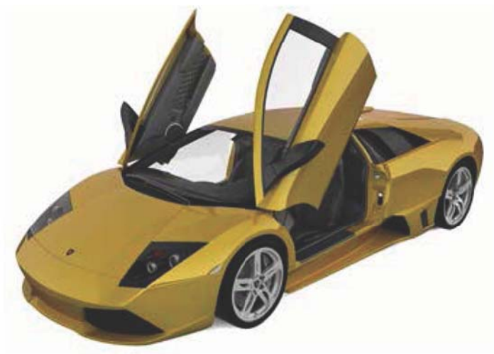
兰博基尼蝙蝠（2007 年款）