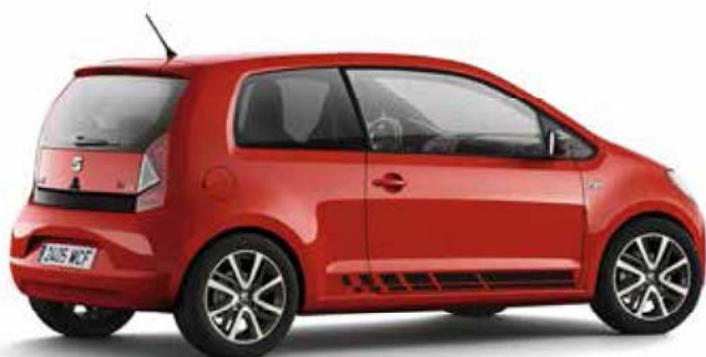
西亚特 Mii（2023 年款）