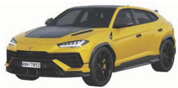
兰博基尼野牛（2023 年款）