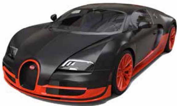
布加迪威龙（2016 年上市）