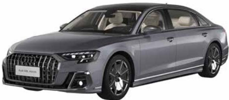
奥迪 A8L 霍希版（2022 年款）