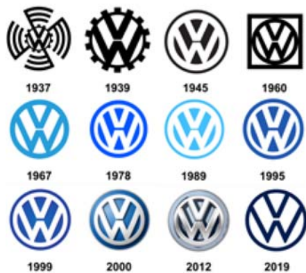
大众品牌标志演变历程

斯将大众汽车德文全称 Volks Wagen 的首字母“V”和“W”上下排列并放在一个圆形齿轮中，外围加上齿轮、风扇元素，于 1938 年申请商标。后来，齿轮、风扇元素被取消。二战后，随着公司战略的变化，大众汽车持续设计出不同样貌的标志，但基本组成与构图皆维持不变。从整体来看，大众汽车的标志很像三个用中指和食指比画出的“V”，而“V”有着胜利的意思，象征大众汽车公司及产品必胜、必胜、必胜。