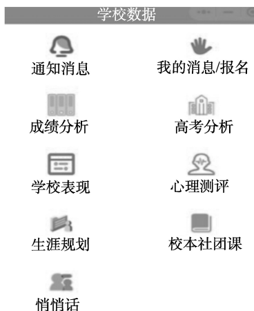
图 1-3 青岛九中 App 界面