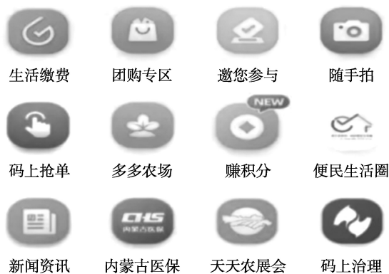
图 1-4 “多多评”平台部分功能

鄂尔多斯市康巴什区通过“多多评”平台，以数字化、智能化手段进行基层社会治理，提高了社会治理的科学性、精准性和有效性。