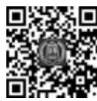
视频 1-2 资产评估执业准则

该准则的修订和实施是在财政部的指导下进行的,中国资产评估协会根据《资产评估基本准则》对《资产评估执业准则——资产评估程序》进行了修订,并自特定日期起施行,以确保资产评估行业的规范化和专业化发展。