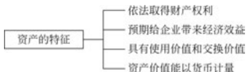
图 1-1 资产的特征

(1) 依法取得财产权利是经济主体拥有并支配资产的前提条件。在资产评估中应了解被评估资产的产权构成。资产评估中的资产不应仅以所有权作为界定依据,一些资产,如特许经营权、采矿权,企业只有控制权而无所有权,但由于其能为企业带来净现金流,也应作为企业的资产加以确认。