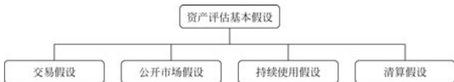
图 1-2 资产评估基本假设

假设是资产评估结论成立的前提条件。在资产评估中,主要有四项基本假设,如图 1-2 所示。